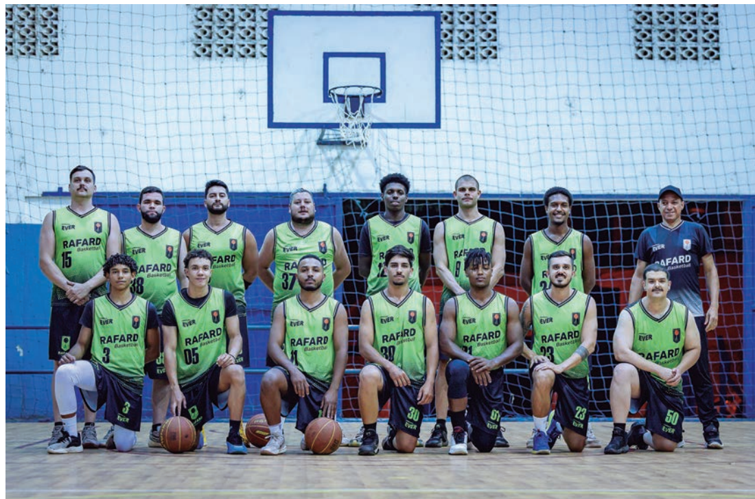
Equipe de basquete de Rafard, Ravens Basketball que enfrentou Cerquilha no amistoso

trou determinação em quadra, mas enfrentou dificuldades contra o ritmo dos Gamblers, que aproveitaram melhor as oportunidades durante o jogo. Para Hélio, a experiência foi valiosa para identificar áreas de melhoria e fortalecer a preparação do time: “Queremos inspirar jovens e construir uma cultura sólida em torno do basquete na cidade”.