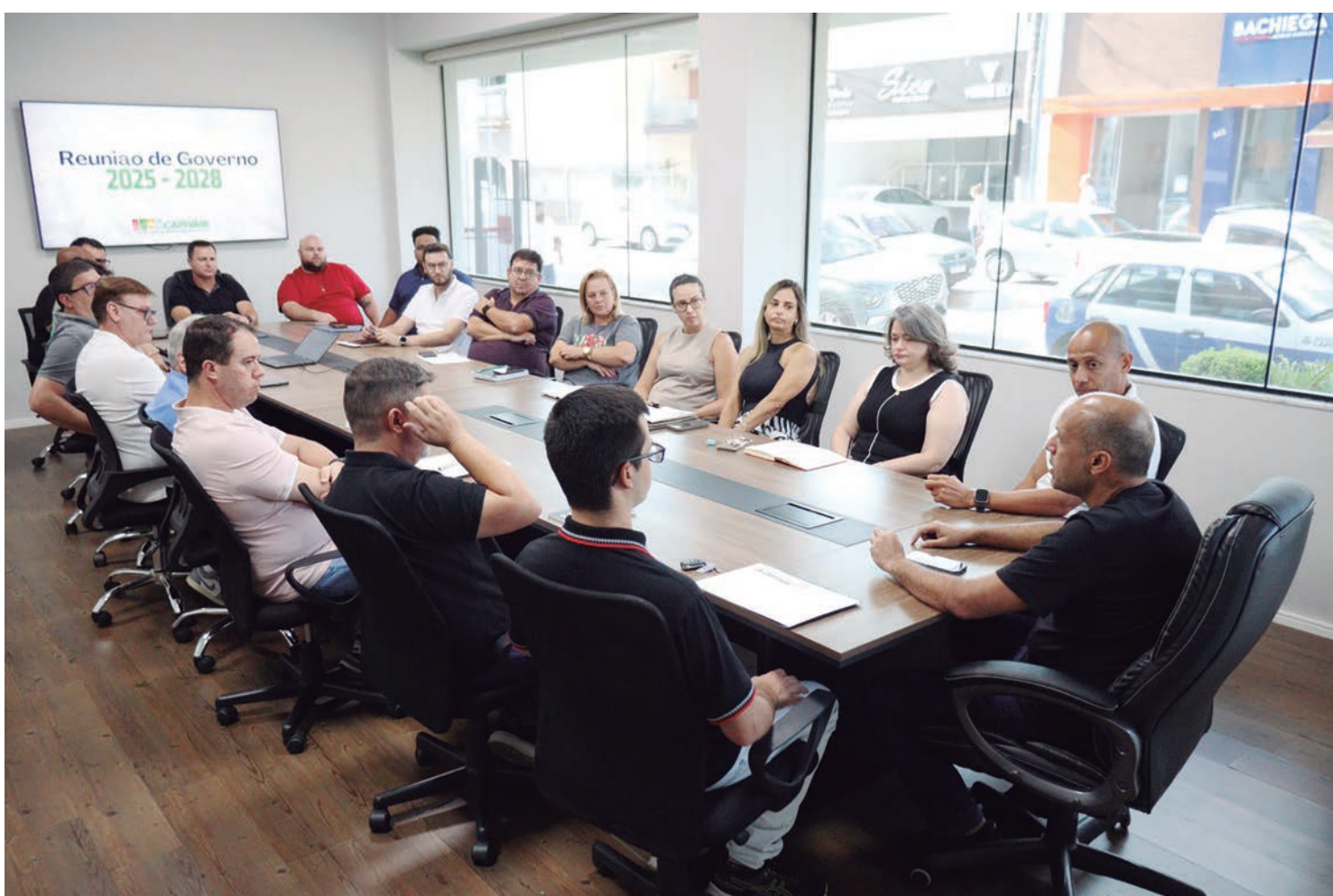
Primeira reunião de governo com os novos secretários municipais aconteceu nesta semana