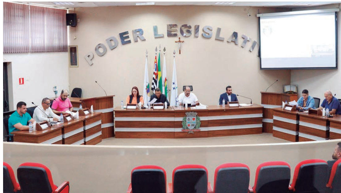
Vereadores de Rafard reunidos para primeira sessão extraordinária do ano

A Câmara Municipal de Rafard realizou na tarde da última terça-feira, 14, as primeiras sessões extraordinárias da nova legislatura. Com uma pauta enxuta, os vereadores aprovaram três projetos importantes, todos por unanimidade.