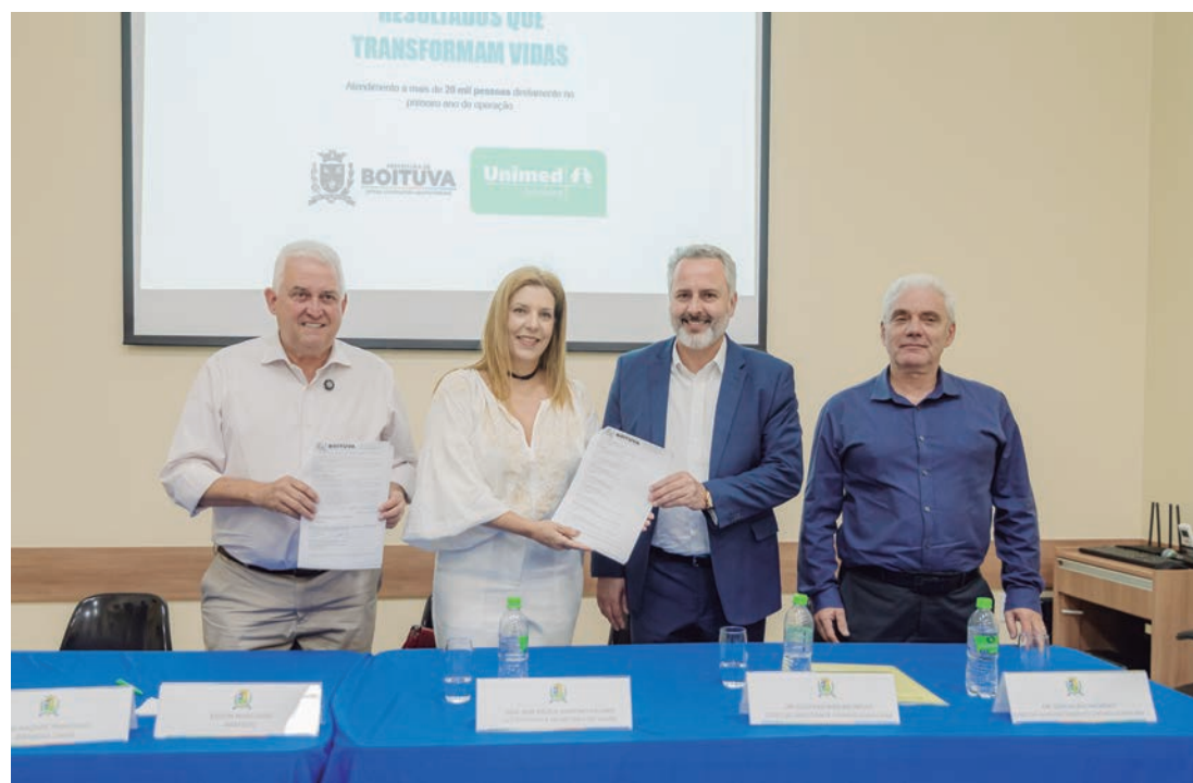
Contrato que irá viabilizar a construção foi assinado no final de novembro

Com a construção da unidade de Boituva, a Unimed Sorocaba passará a oferecer mais um ponto de atendimento aos clientes, que hoje contam com o Hospital Unimed Sorocaba - Dr. Miguel Soeiro, referência em atendimento de alta complexidade; o Hospital Unimed Sorocaba - Dr. Rodolfo Pinto Machado Araújo, inaugurado recentemente no centro de Sorocaba; a Unidade Avançada Zona Norte, localizada no Shop-