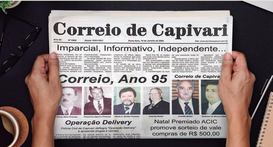
Capa da edição especial dos 95 anos do jornal Correio de Capivari

O Correio de Capivari, reconhecido como o jornal mais antigo e tradicional da cidade, celebra 95 anos de compromisso com a informação e a comunidade local. Fundado em 1931 sob o nome de Correio Paroquial, o periódico consolidou-se como uma fonte confiável de notícias, preservando sua linha editorial informativa, imparcial e independente.