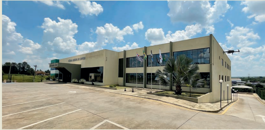
Segunda sessão extraordinária do ano acontece no Palácio 10 de Julho

A Câmara Municipal de Capivari realiza nesta sexta-feira, 17, às 17h, a segunda sessão extraordinária do ano. Com uma pauta robusta, 15 projetos de lei de autoria do Poder Executivo serão discutidos em caráter de urgência, abrangendo desde recuperação fiscal até investimentos em infraestrutura urbana.