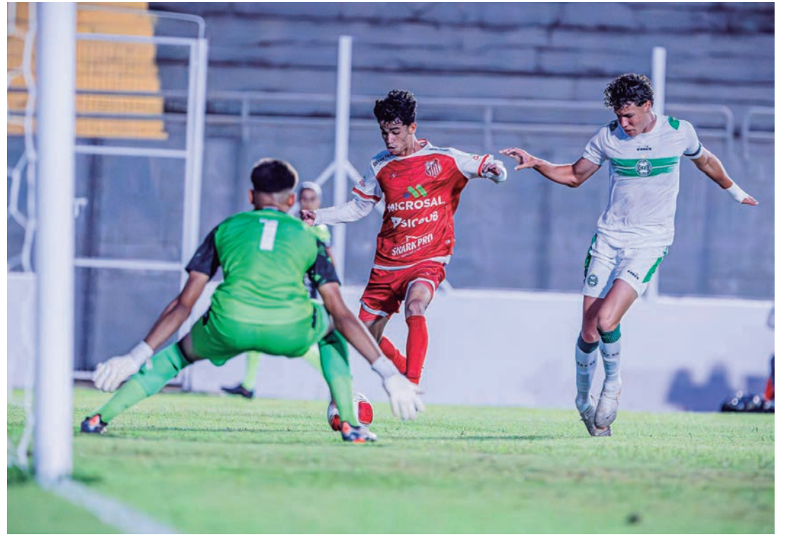
Capivariano atacou durante toda partida, mas cedeu empate no final