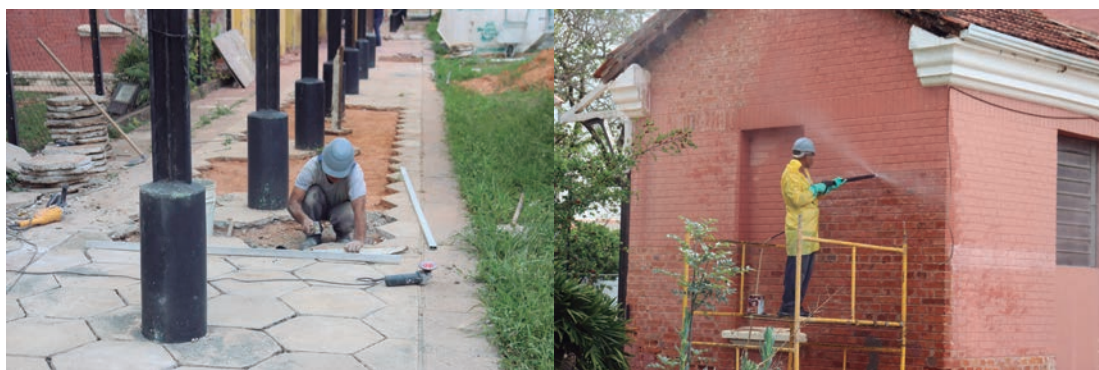
Calçamento está sendo reparado e área externa do prédio lavada