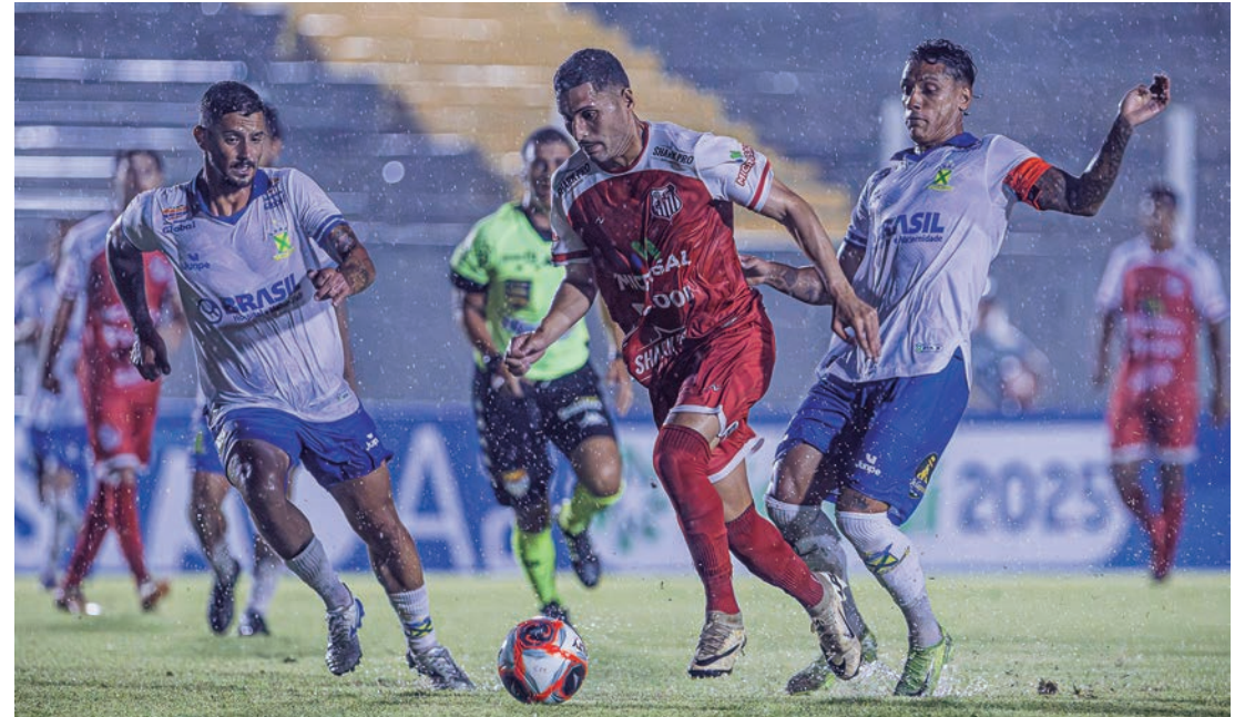
Debaixo de muita chuva, Leão da Sorocabana bateu o Santo André por 1 a 0

será no domingo, 19, às 11h, quando enfrentará a Portuguesa Santista, fora de casa.