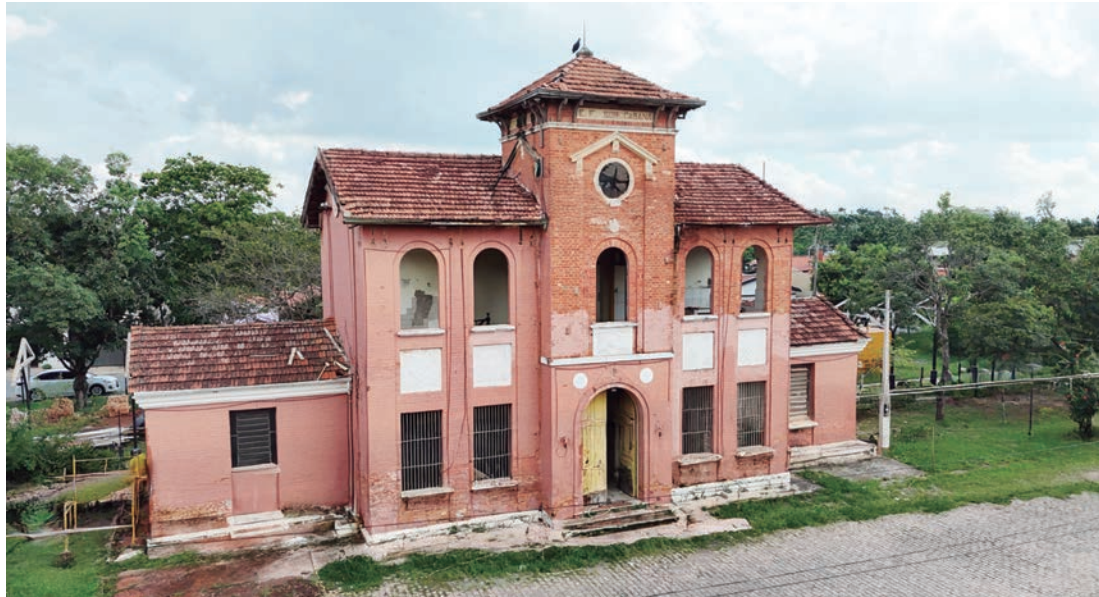
Todo o prédio e seu entorno passará por reformas e melhorias

Um dos marcos históricos de Capivari está passando por uma grande obra de restauro, que em breve vai entregar à população o prédio que no passado abrigou a Estação Sorocabana Railway Company. As obras tiveram início no final do ano passado e devem se estender por todo o primeiro semestre de 2025, sob supervisão da Secretaria de Planejamento e Urbanismo.