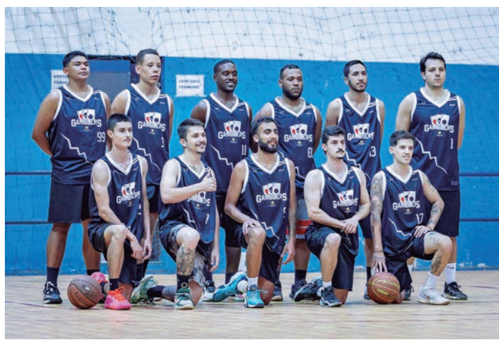
Equipe Gamblers venceu Rafard por 54x32

novos desafios, mantendo o foco no crescimento técnico e no impacto social que o esporte pode oferecer à toda comunidade.