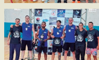
Três melhores equipes premiadas durante o torneio