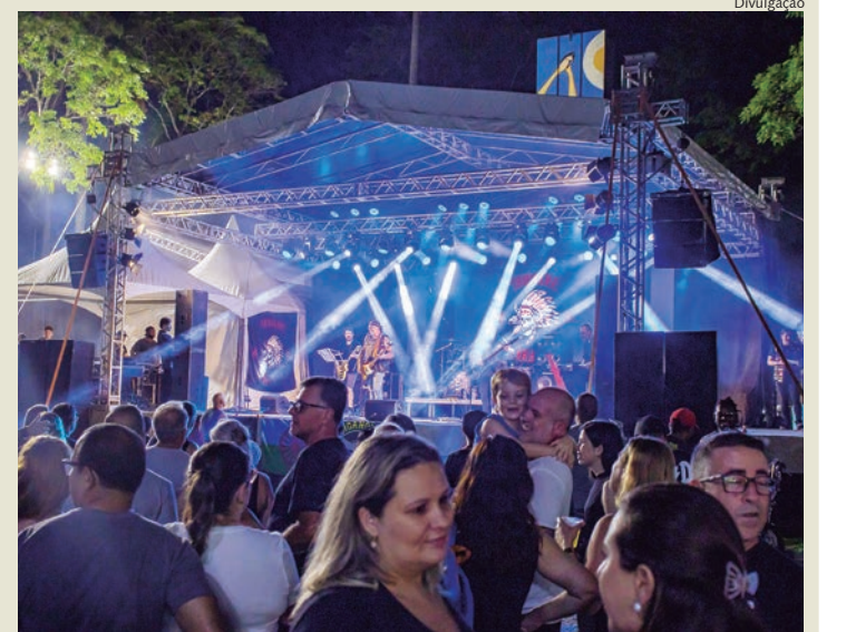
Shows no platô da Praça Central agitam tradicional evento

As festividades na Praça Central continuam durante o mês de dezembro, com destaque para a última edição da Feira Noturna deste ano, que aconteceu na última quinta-feira, 12. A programação do “Natal Encantado” também terá início nesta sexta-feira, 13, trazendo ainda mais atrações para a população.