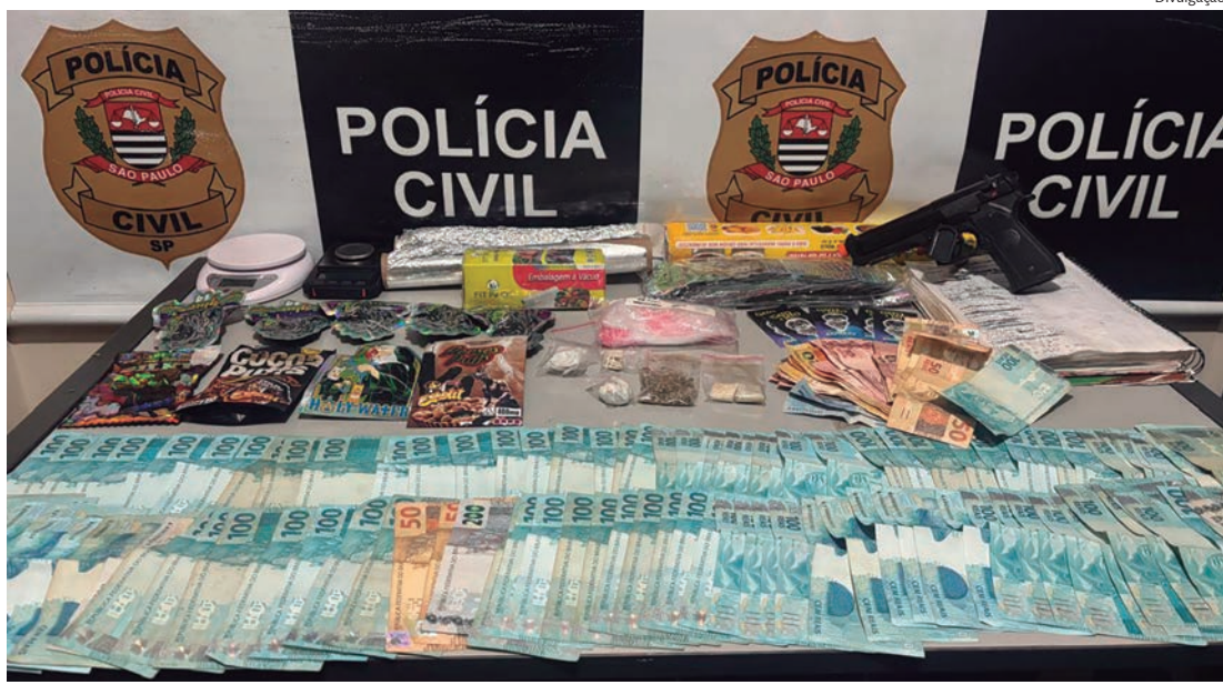
Grande quantidade de dinheiro, arma e drogas apreendidas em operação policial em Capivari