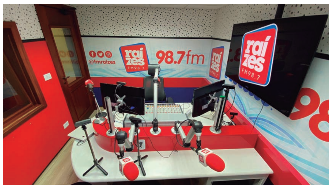
Estúdio principal da rádio Raízes FM, que atua na sintonia 98,7 Mhz desde 1989

Com ética, credibilidade e inovação, a Raízes FM segue firme em sua missão de ser uma referência na comunicação regional, inspirando novas gerações e fortalecendo os laços com a comunidade.