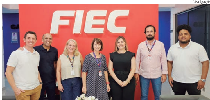
Comitiva capivariana em visita à FIEC Indaiatuba

A FIEC é uma renomada instituição de en-