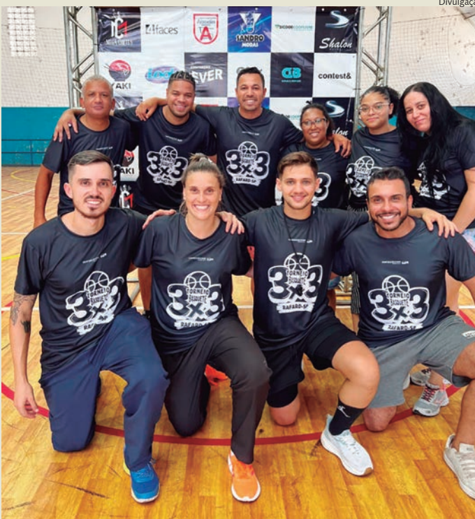
Organização do torneio 3x3 em Rafard

O esporte em Rafard viveu um momento histórico no último sábado, 7, com a realização do primeiro torneio 3x3 de basquete. O evento reuniu oito equipes das cidades de Cerquillo, Laranjal Paulista, Tietê, Rio das Pedras, Capivari e Rafard, no ginásio municipal de esportes Olavo de Campos Borghesi. A competição marcou uma celebração do esporte regional e teve premiação para os três primeiros colocados.