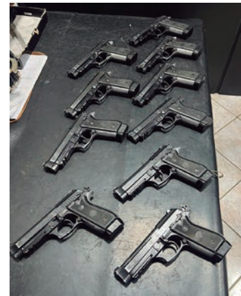
Dez pistolas .380 foram doadas à GCM de Socorro

Desde o começo da gestão, mais de 90 pistolas Imbel MD6, fuzis, carabinas e equipamentos de menor potencial ofensivos foram entregues para a Guarda Civil de Capivari. A cidade também conta com um veículo blindado, mais de 200 câmeras de monitoramento e muita tecnologia de ponta para combater crimes.