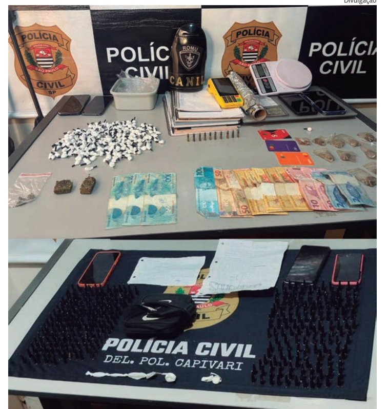
Grande quantidade de entorpecentes, armas e dinheiro apreendidos em operação da Polícia Civil

Foram apreendidos entorpecentes como crack, cocaína e maconha, além de mais de R$ 4 mil em dinheiro, diversos celulares, aparelhos eletrônicos, máquinas caça-níquel, duas motocicletas e materiais utilizados no tráfico de drogas, como balanças de precisão e cadernos de anotações. Cinco