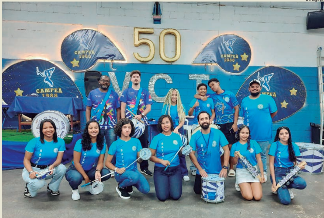
Novos alunos foram certificados pela oficina de ritmistas e de dança da Vai Com Tudo e +10

Na última terça-feira, 10, a Escola de Samba Vai Com Tudo e +10 realizou a formatura dos alunos das Oficinas de Ritmistas e de Dança (Samba), em sua sede. Durante o evento, foram entregues certificados de participação aos novos alunos, celebrando a conclusão das atividades realizadas ao longo do ano.