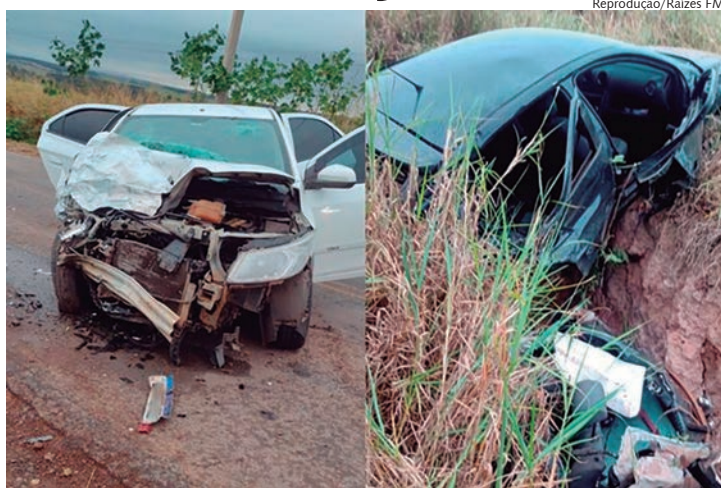
Com a gravidade do acidente, rodovia foi parcialmente bloqueada

De acordo com informações preliminares, o acidente ocorreu quando o condutor de um Volkswagen Gol, que transportava três passageiros, perdeu o controle do veículo e colidiu de frente com um Chevrolet Onix, que trafegava na direção oposta com cinco ocupantes, incluindo uma criança. O impacto da colisão foi