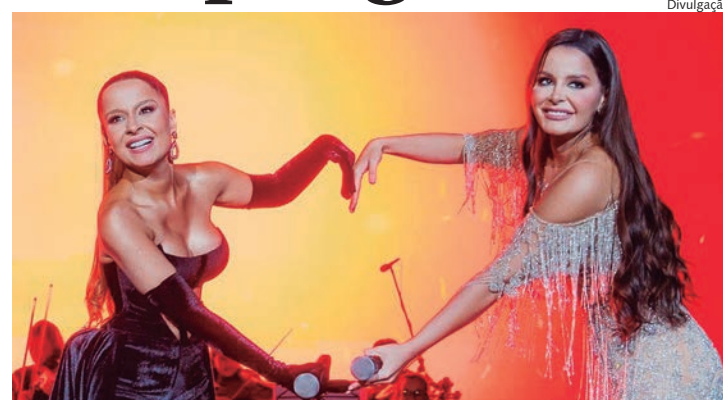
Em outubro, as gêmeas queridinhas do Brasil estarão em Capivari

A suspensão repentina dos shows pegou de surpresa não só os fãs, mas também os organizadores de grandes eventos em todo o país, incluín-