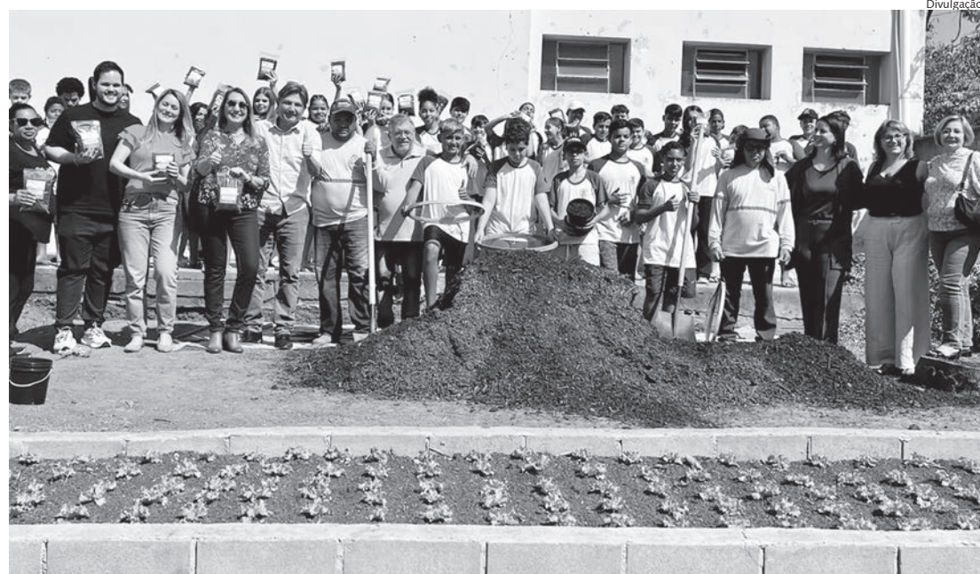
Composto orgânico será utilizado na horta da própria escola e na casa dos estudantes