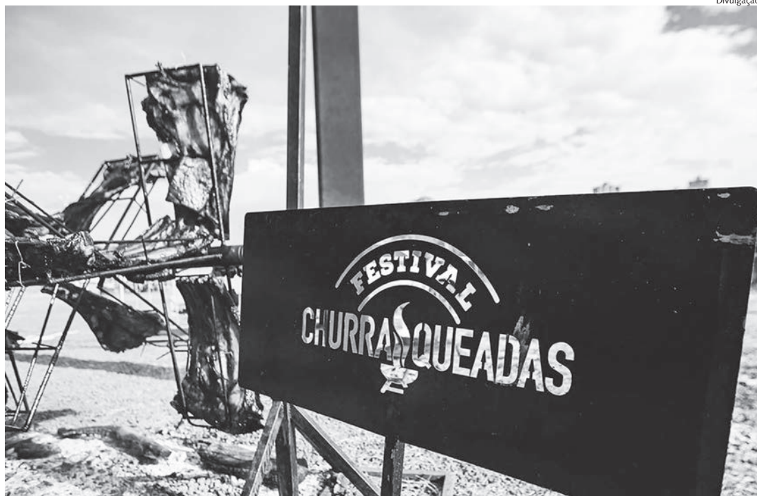
Festival Churrasqueadas será realizado no Espaço de Eventos Bicho de Pé, em Rafard

Reconhecido como o maior festival de churrasco do país, o Churrasqueadas traz uma experiência completa para os participantes, que poderão se deliciar com uma ampla seleção de carnes, preparados por renomados mestres assadores. No cardápio,