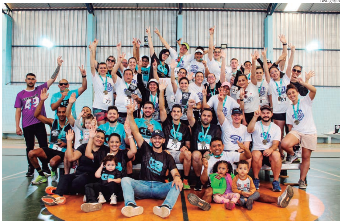
Atletas foram premiados no ginásio Antonio Cerezer, localizado no centro esportivo