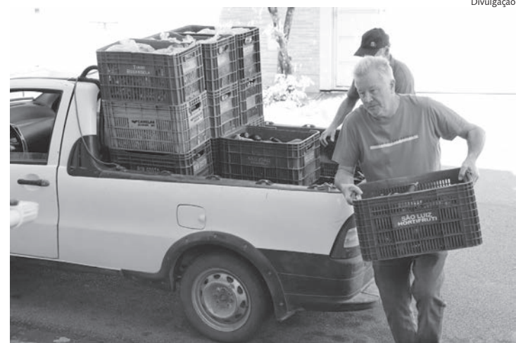
26 toneladas de alimentos foram entregues para famílias

Executado em São Paulo pela CATI, o PAA compra alimentos produzidos pela agricultura familiar, e os destina às