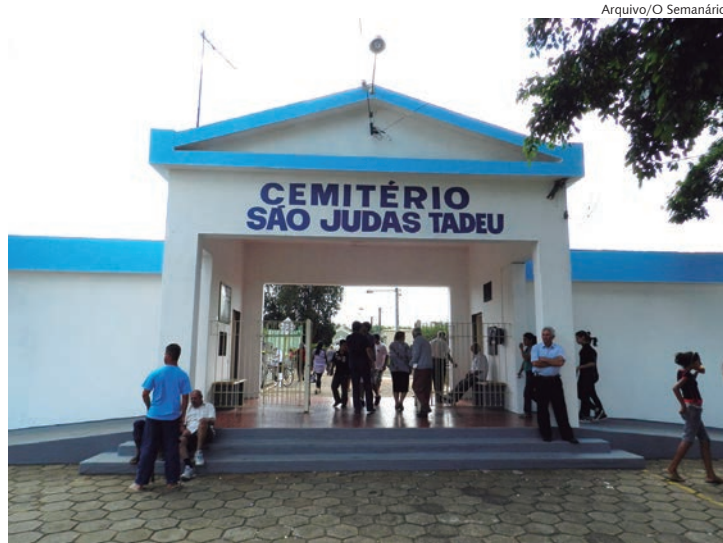
Vulnerabilidade de segurança no Cemitério São Judas Tadeu

A indignação dos moradores se manifesta nas redes sociais, onde fotos e vídeos dos danos causados aos jazigos são compartilhados diariamente. A cobrança por medidas para coibir esses crimes é unânime entre os familiares das vítimas.