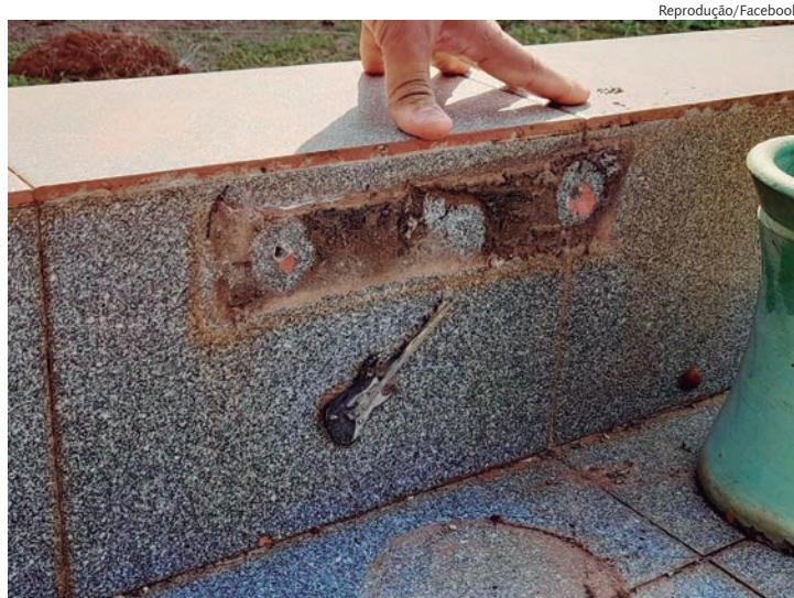
Famílias tem compartilhado imagens dos furtos nas redes sociais

farad, apenas uma família registrou boletim de ocorrência relacionado a furto no cemitério municipal. "É fundamental que todas as famílias que tiveram seus túmulos violados registrem um Boletim de Ocorrência (B.O.) na Delegacia de Polícia de Rafard. Com