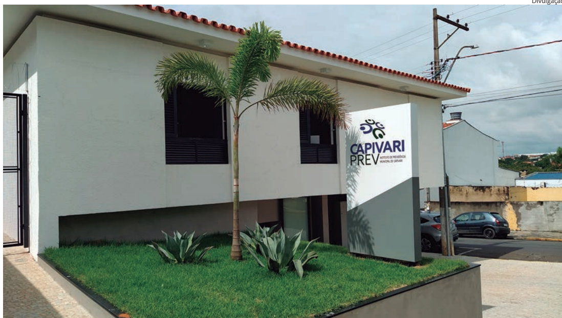
CapivariPrev está localizado na rua Tiradentes, 650, no Centro de Capivari

A medida entrou em vigor no dia 1º de agosto e vale para todos os aposentados e pensionistas do CapivariPrev. Além da opção online, os beneficiários ainda podem realizar a Prova de Vida presencialmente, na sede do instituto, localizada na Rua Tiradentes, nº 650, Centro. O atendimento é de segunda a sexta-feira,