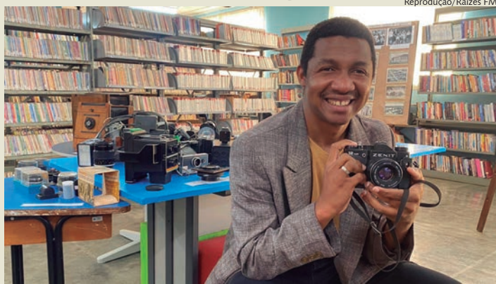
Exposição segue até 26 de agosto, na biblioteca municipal

A mostra apresenta uma coleção de máquinas fotográficas antigas, fotos históricas que retratam a evolução da técnica fotográfica e, para completar a experiência, um estúdio fotográfico onde os visitantes podem posar para fotos profissionais e recebê-