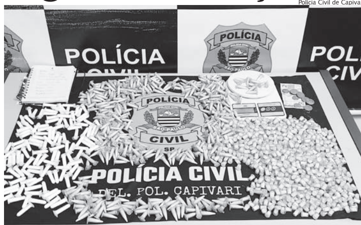
Grande quantidade de entorpecentes apreendidos pela PC

Segundo a nota oficial da PC, a equipe encontrou uma quantidade significativa de drogas, sendo 154 porções de cocaína e 1.255 porções