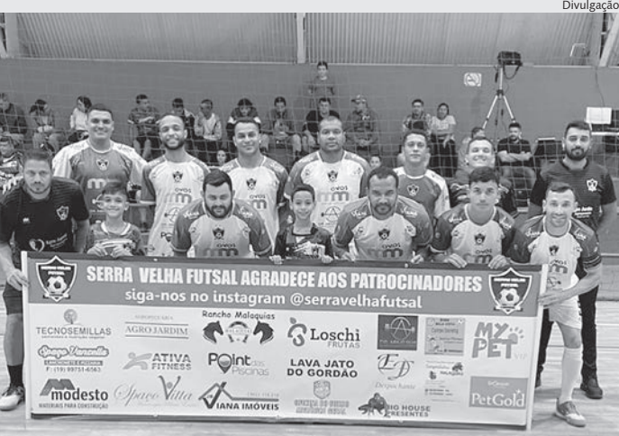
Serra Velha Futsal, de Cardeal, briga pelo título em Rafard

A programação do evento inclui um jogo preliminar da categoria sub-12, onde a equipe Rafard Futsal enfrentará o Panorama às 19h30. Logo após, às 20h30, acontecerá a tão aguardada final entre 12 de Junho e Serra Velha. Ambas as equipes têm mostrado um desempenho impressionante ao longo do torneio, prometendo um confronto equilibrado e emocionante.