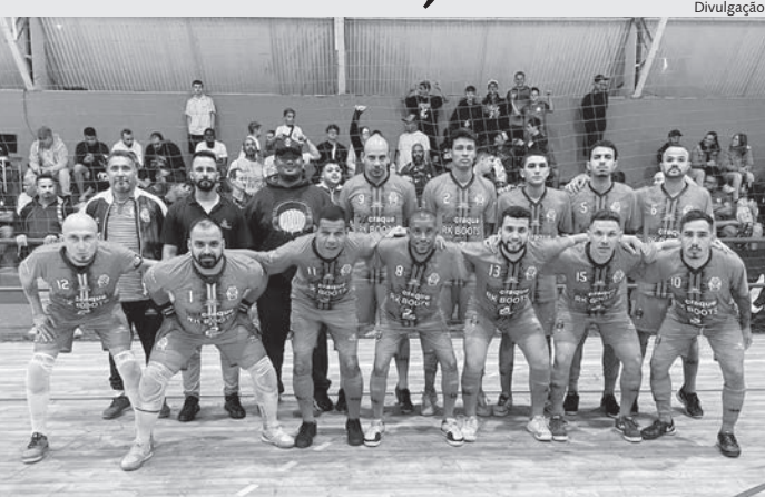
Equipe 12 de Junho, de Indaiatuba, é uma das finalistas

A esperada final da Copa Bachiega de Futsal promete agitar a cidade de Rafard nesta sexta-feira, 19. Organizado pela Prefeitura de Rafard e pela Diretoria de Cultura, Esporte e Turismo, o evento será realizado no ginásio municipal Olavo de Campos Borghesi, com entrada gratuita para todos os espectadores.