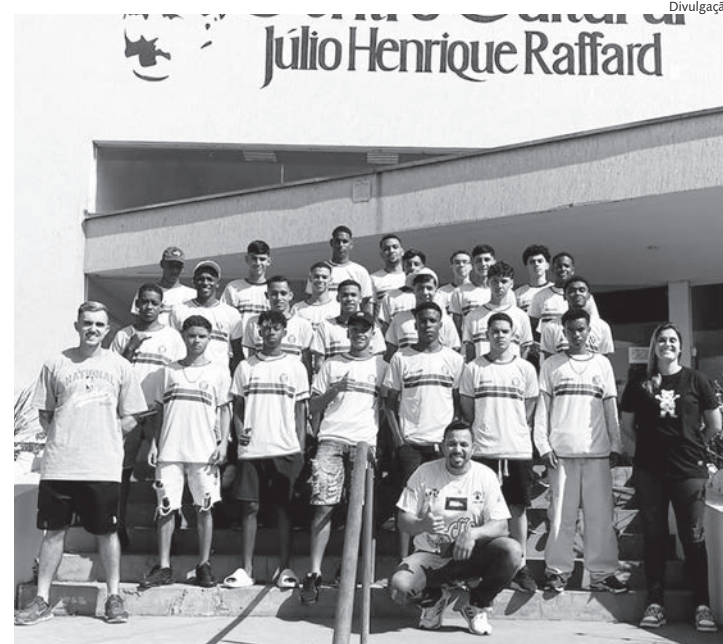
Atletas que participaram da abertura dos Jogos Regionais

Os Jogos Regionais são uma vitrine importante para o talento esportivo da região, oferecendo uma plataforma para atletas de diversas modalidades mostrarem suas habilidades e competirem em alto nível. A competição também promove o intercâmbio cultural e esportivo entre os municípios participantes, fortalecendo o espírito de camaradagem e a união através do esporte.