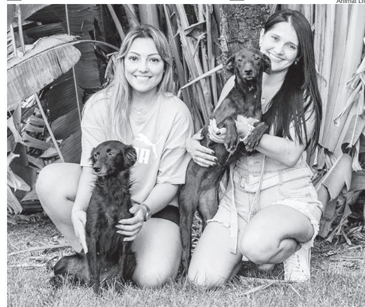
Grupo de voluntários da causa animal, Animal Life, foi escolhido para participar da promoção em Capivari

zará um espaço para receber doações de rações e produtos pets em todas as suas lojas. “O Covabra é engajado em promover o bem para a sociedade como um todo, seja na hora de ofertar seus produtos ou em ações. Desde o ano passado, realizamos essa corrente do bem em prol da causa animal, com a realização de feiras de adoção de animais que buscamos um novo lar e com a doação para as ONGs, auxiliando a manter esse projeto tão lindo de promover o bem-estar, saúde e amor