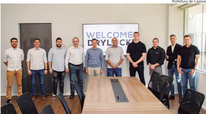
Prefeitura de Capivari

A Drylock Technologies é uma empresa belga, que chegou ao Brasil em 2018. Página 12