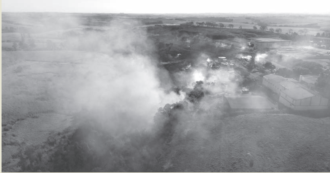
Incêndio chegou próximo a empresas alocadas no Distrito Industrial de Rafard

Na manhã desta quarta-feira, 19 de junho, um incêndio de grandes proporções atingiu uma extensa área de vegetação no distrito industrial de Rafard. O Corpo de Bombeiros recebeu o chamado por volta das 10h e rapidamente se deslocou para o local.