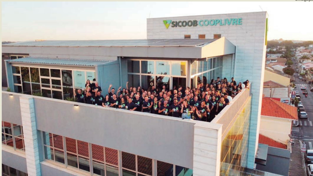
Equipe do Sicoob Cooplivre na sede localizada no Centro de Capivari

Pelo quarto ano consecutivo o Sicoob Cooplivre conquistou o título de melhores empresas para se trabalhar no Brasil. O selo GPTW (Great Place to Work) é resultado de uma pesquisa com os colaboradores que analisa o clima e a cultura organizacional.