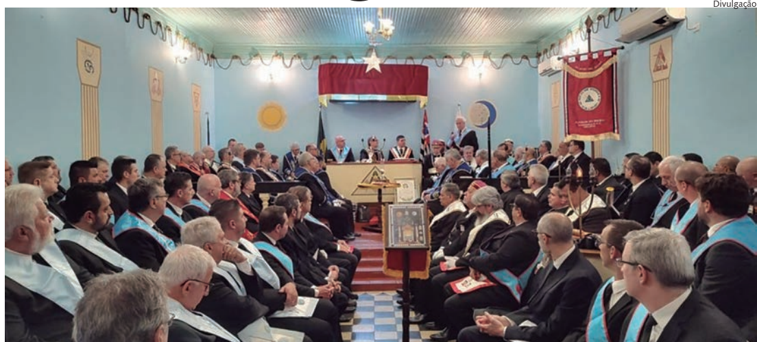
Loja Maçônica Integridade é uma instituição iniciática, filosófica, filantrópica, educativa e progressista