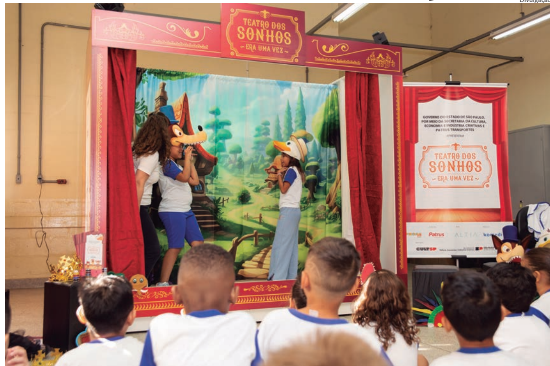
Ao todo, 150 crianças de três escolas municipais de Hortolândia participaram do projeto

Nos dias 10 e 11 de junho foram realizadas 3 apresentações do espetáculo “Teatro dos Sonhos”, em Hortolândia. O projeto contou com a confecção e distribuição de cinco estruturas de teatro móvel, com palco, equipamentos de som e luz, cortinas e cenários, bem como acervo de materiais, livros, fantasias, fantoches, adereços e trilhas sonoras. Ao todo, 150 crianças participaram do projeto.