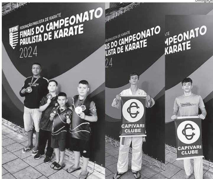
Caratecas da Washi-Ki-O que participaram do Paulista

A Associação Washi-Ki-O de Capivari foi destaque na competição, participando com seis atletas e conquistando quatro medalhas: uma de ouro, duas de prata e duas de bronze. Com esse desempenho, cinco atletas garantiram classificação para as Finais