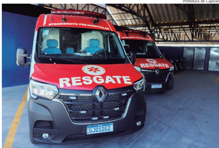
Resgate 153 foi implantado em Capivari em novembro de 2023

A equipe está treinada e equipada para atender em qualquer cenário”, detalhou o secretário da Segurança Pública de