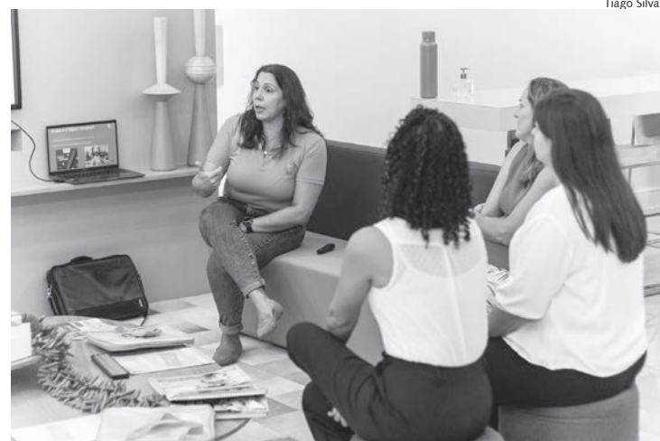
Método Super Cérebro foi apresentado para mães e crianças

O Método Super Cérebro é um programa que visa impulsionar o desenvolvimento integral de crianças, jovens e adultos. Mediante uma abordagem holística que integra ferramentas pedagógicas eficazes e um ambiente de aprendizado estimulante, o método busca fortalecer as habilidades cognitivas e socioemocionais dos alunos, preparando-os para o sucesso em todas