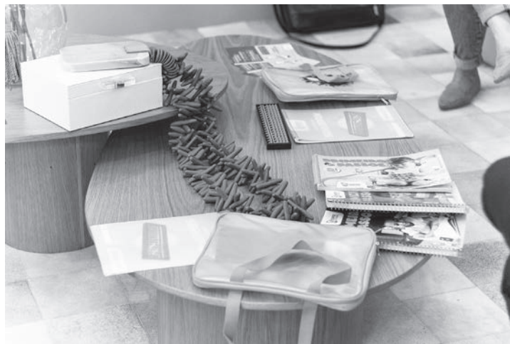
Jogos e literaturas utilizadas para o desenvolvimento