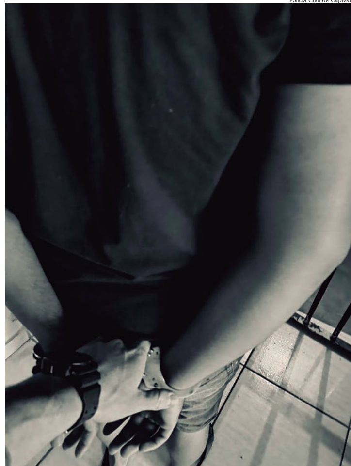
Polícia Civil de Capivari

Nove homens foram presos por crimes de inadimplência de pensão alimentícia, tráfico de drogas, crimes de trânsito e ameaça. Além das prisões, os policiais e guardas localizaram na tarde