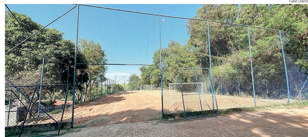
Espaço ainda precisa de melhorias, como poda das árvores e manutenção dos alambrados