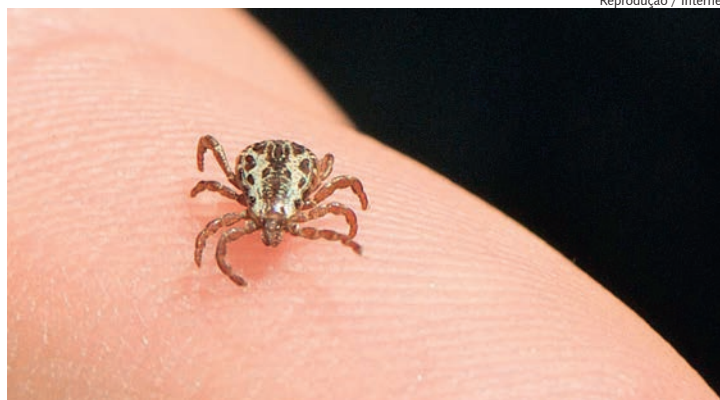
Em caso de sintomas procure imediatamente o médico

De acordo com a Defesa Civil de Capivari, os pontos que podem oferecer risco de contaminação pela doença, são os locais próximos ao Rio Capivari e córregos, como nos bairros Estação, Centro (trecho da rua Tiradentes e próximo ao Cortume), Vila Cardoso (Campo de Futebol e rua São Paulo), próximo à ponte do Santoro (Domingos Pavan e avenida Marlene do Carmo Rossi), áreas próximas do córrego Água Choca (Juventus, Vila Clemente, rua Padre Haroldo), pro-