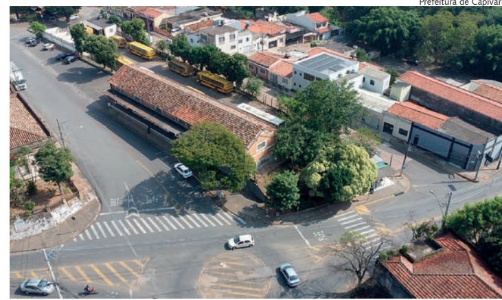
Ponte vai integrar centro e bairros de Capivari

Ainda na área da Educação, o prefeito e vice-prefeito frisaram a cobertura das quadras das escolas Aldo Silveira, no Moreto, Cherubim Sampaio, na Vila Izildinha e Lúcia