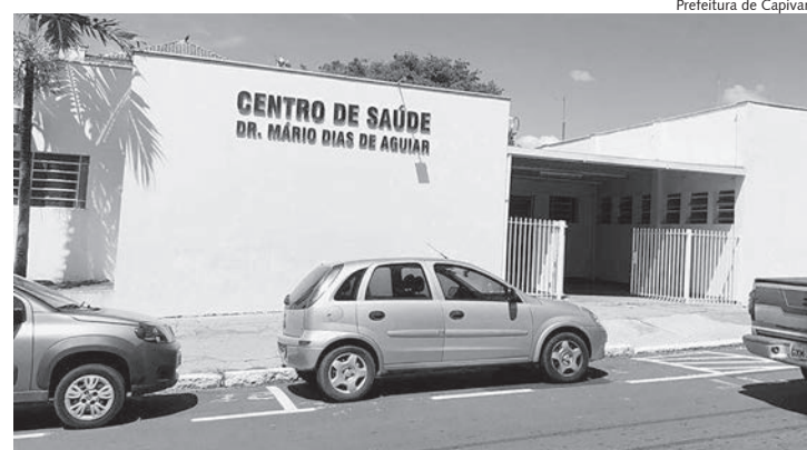
Centro de Saúde Dr. Mário Dias de Aguiar

Para o pré-cadastro os moradores precisam apre-