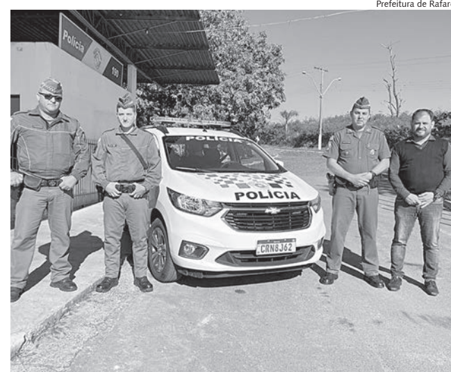
Prefeito Fabinho acompanhou entrega da viatura

A Polícia Militar de Rafard foi contemplada com uma nova viatura Spin 0km, graças ao apoio do Governo do Estado de São Paulo. A chegada desse veículo moderno e totalmente equipado fortalecerá ainda mais o trabalho realizado pela corporação em prol da segurança e do bem-estar da população local.