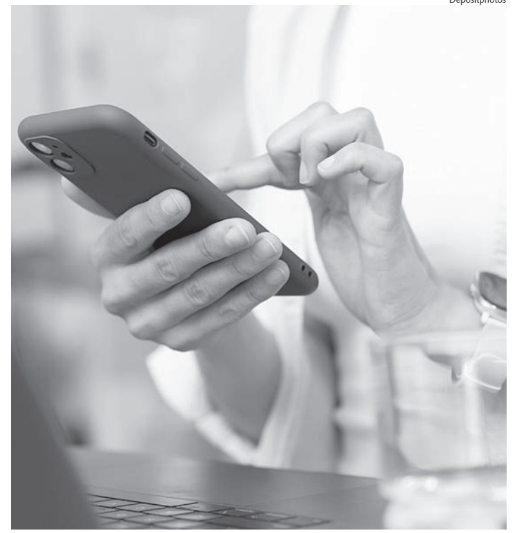
Jovem de Rafard e amiga caíram em golpe na internet

É fundamental que as plataformas de mídia social também aprimorem seus mecanismos de segurança e agilizem a remoção de contas suspeitas, a fim de evitar que mais pessoas se tornem vítimas de golpes virtuais como esse.