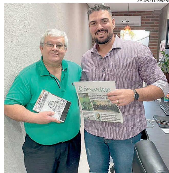
Arquivo / O Semanário Pároco celebra últimas missas no fim de semana

O padre reservou um agradecimento especial ao Bispo Diocesano,