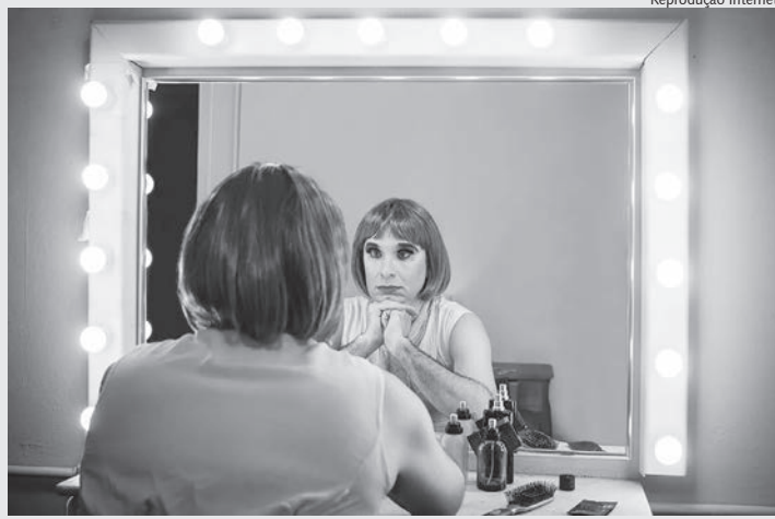
Peça será apresentada no centro cultural Júlio Henrique Raffard