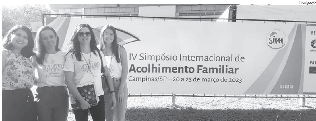
Equipe do Teto & Afeto que participou do simpósio em Campinas

No mês de março, Campinas sediou o IV Simpósio Internacional de Acolhimento Familiar, um evento que reuniu profissionais e especialistas para discutir e compartilhar experiências sobre o acolhimento de crianças e adolescentes em situação de vulnerabilidade. A equipe da instituição Teto & Afeto - Família Acolhedora de Capivari marcou presença no simpósio, não apenas com o intuito de aprimorar seus conhecimentos, mas também com a honra de apresentar um trabalho para o público presente.