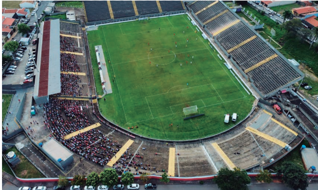
Grande final acontece na Arena Capivari, neste sábado (13), às 15h

Neste sábado (13) às 15h, o Capivariano Futebol Clube enfrenta o São José Esporte Clube, na grande final da Série A3 do Campeonato Paulista. Com a vantagem do gol marcado no jogo de ida, a Águia do Vale precisa de um empate para levantar o troféu, já o Leão, precisa de uma vitória simples para reverter o placar.