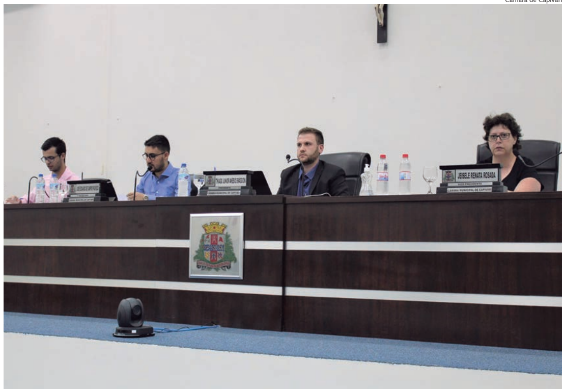
Projeto de Lei foi aprovado na sessão ordinária da última segunda-feira (24)

De autoria da Mesa Diretora, o projeto de lei nº 04/2023, que dispõe sobre a consolidação e atualização da estrutura administrativa da Câmara Municipal de Capivari, foi aprovado na noite da última segunda-feira, 24, durante a 12ª sessão ordinária.