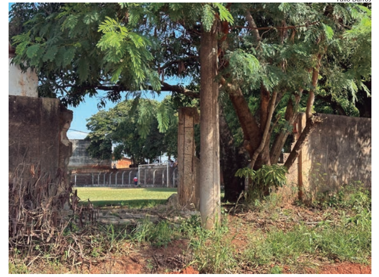
Um dos muitos trechos que estão com o muro deteriorado

Além disso, Doca também criticou a falta de infraestrutura no local. Segundo ele, o muro não