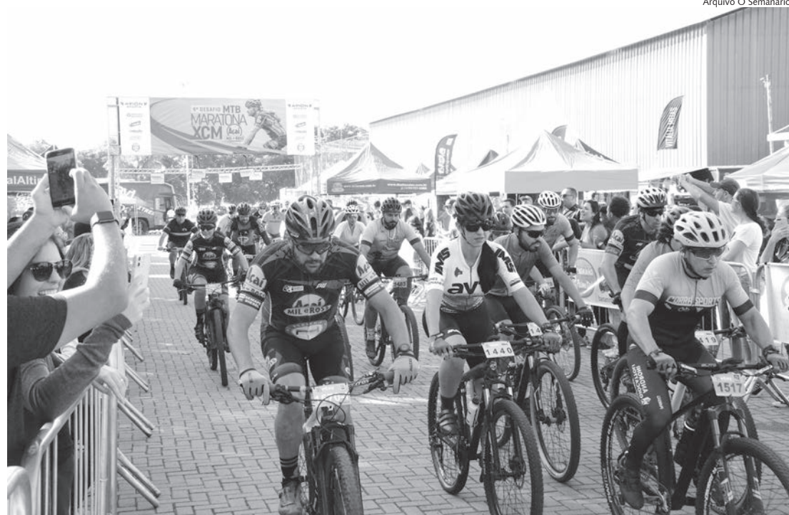
Largada e chegada acontece no centro esportivo Reinaldo Fontolan, a partir das 8h

A entrega dos kits acontece no domingo, 23, a partir das 6h, e está condicionada a doação de 1 kg de alimento não perecível (não será aceito sal e açúcar) ou 1 litro de leite. A largada está prevista para às 8h nas categorias Pró e Elite, que percorrerão o percurso de 60km. Às 8h30, será a vez da categoria