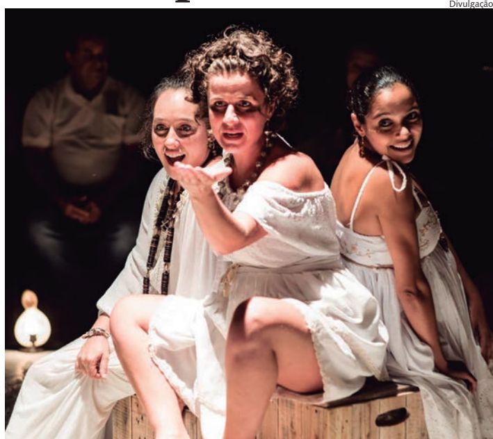
Grupo Almarrotadas se apresenta no centro cultural

Atualmente, a sociedade observa o agravamento da violência contra a mulher, o crescimento dos casos de feminicídios e uma reação do conservadorismo que opera sistematicamente na privação dos direitos