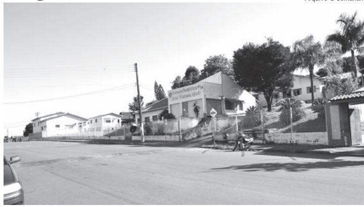
Centro de Vacinação fica anexo à Unidade Básica de Saúde

O atendimento será realizado das 7h30 às 12h30, no antigo “espaço pediátrico”, onde funciona atualmente o Centro de Vacinação do Município. A vacinação estará disponível para os seguintes públicos: crianças entre seis meses e 6 anos de idade; pessoas com 60 anos ou mais; trabalhadores da área da saúde; gestantes e puérperas de até 45 dias; professores, desde o ensino básico até o ensino superior; profissionais de força de segurança e salvamento e também das forças armadas; pessoas por-