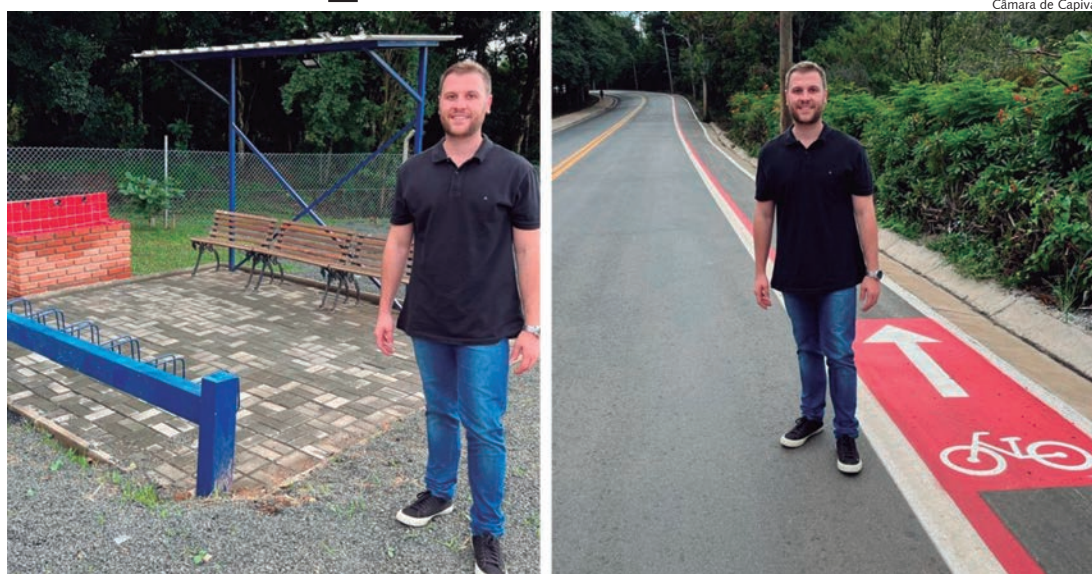
Vereador visitou ponto de pedal na avenida Marlene Rossi

Após o workshop ministrado pela Secretaria