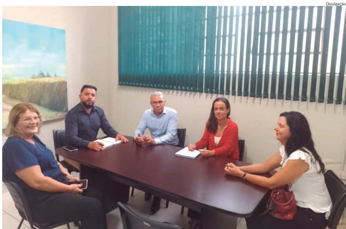
Encontro aconteceu no gabinete do presidente da Câmara de Rafard