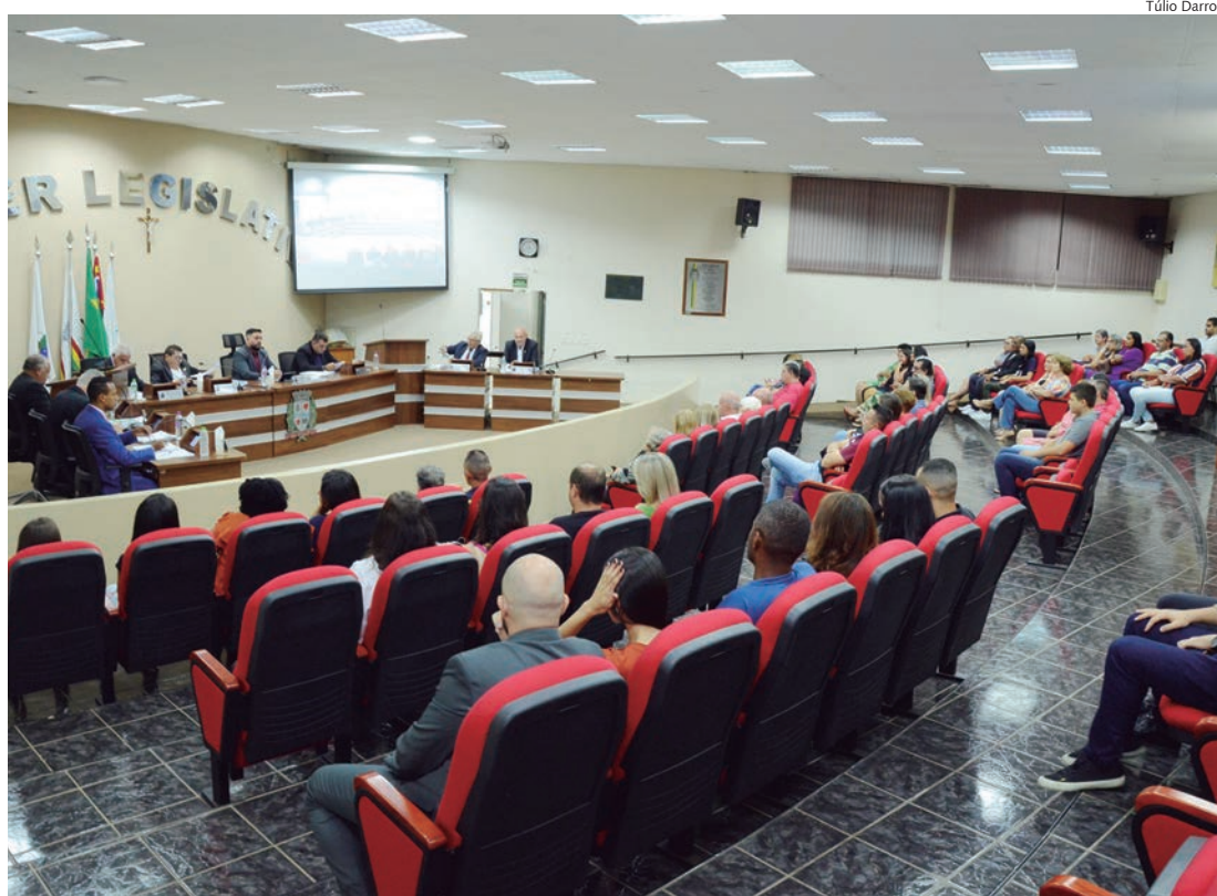
Plenário recebeu familiares e amigos das mulheres homenageadas na noite de terça-feira (7)

Em Rafard, o objetivo do “Prêmio Mulher Destaque” é valorizar a mulher no contexto da cidadania, reconhecendo seus esforços em prol ao fortalecimento da cidadania e o do desenvolvimento social de Rafard.