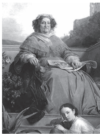
Barbe Nicole Clicquot Ponsardin

É graças a mulheres que foram dominando o mundo dos vinhos que o progresso aconteceu. De facto, empreendedoras e com grandes perspectivas de negócio, mulheres do mundo inteiro renderam-se aos néctares favoritos de Baco.