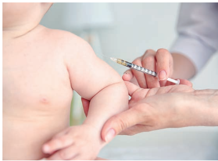
Vacinação deve ser agendada na UBS de Rafard

As crianças que já se imunizaram contra a Covid-19, com a primeira e segunda dose, também já podem receber a terceira dose do imunizante. A vacinação também