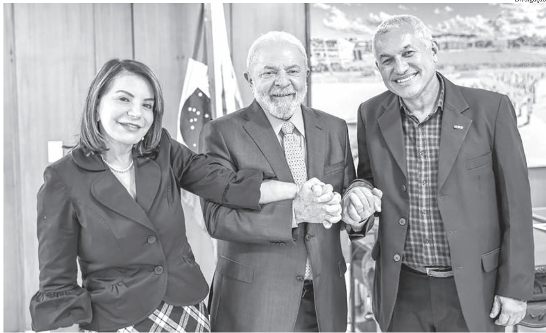
Deputada Bebel, presidente Lula e Heleno Araújo, durante encontro que discutiu educação

ressalta que de acordo com o a prévia do Censo Demográfico do IBGE de 2022, o município de Piracicaba aparece com uma população estimada em 434.432 habitantes. Ao mesmo tempo, observa que levantamento da Fundação Seade indica que 12,3% da população situa-se na faixa etária entre 15 e 24 anos, e que considerando os municípios que compõem a Região Metropolitana de Piracicaba, a população ultrapassa 1,5 milhões de habitantes.