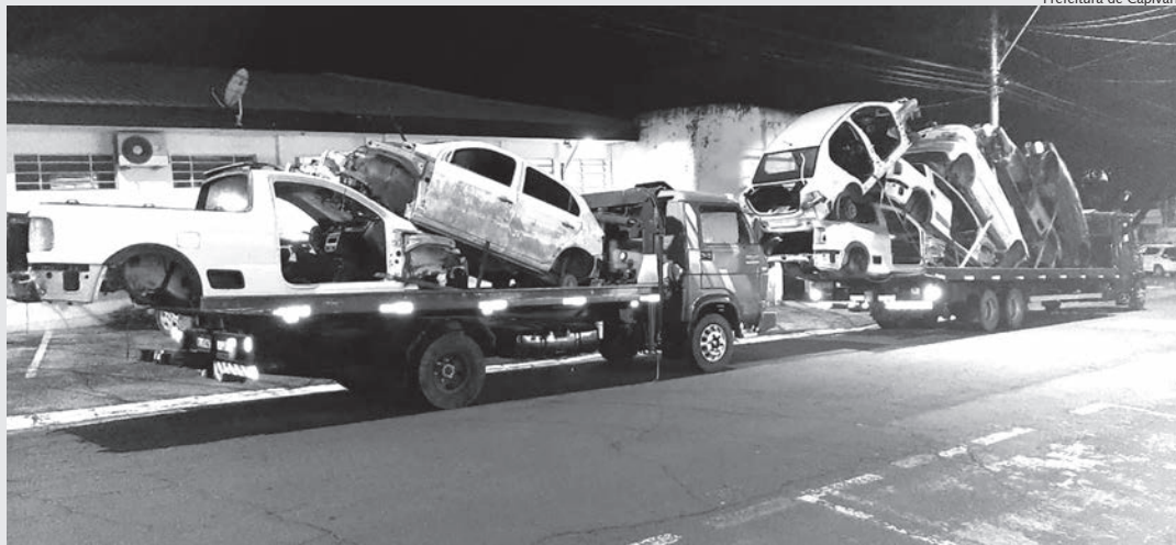
Foram necessários dois caminhões para recolher as 11 carcaças encontradas

Na última semana, oficiais da Guarda Civil de Capivari encontraram 11 veículos desmanchados na área rural da cidade, próximo ao limite dos municípios Capivari, Monte Mor e Santa Bárbara D'Oeste.