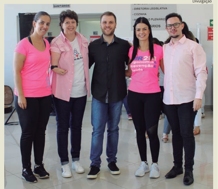
Encontro aconteceu no saguão do Legislativo

A Câmara Municipal de Capivari promoveu uma manhã especial às vereadoras e servidoras na última quarta-feira, 08, em comemoração ao Dia Internacional da Mulher, começando com uma aula de ginástica laboral oferecida pela R2 Prevenção e Saúde.