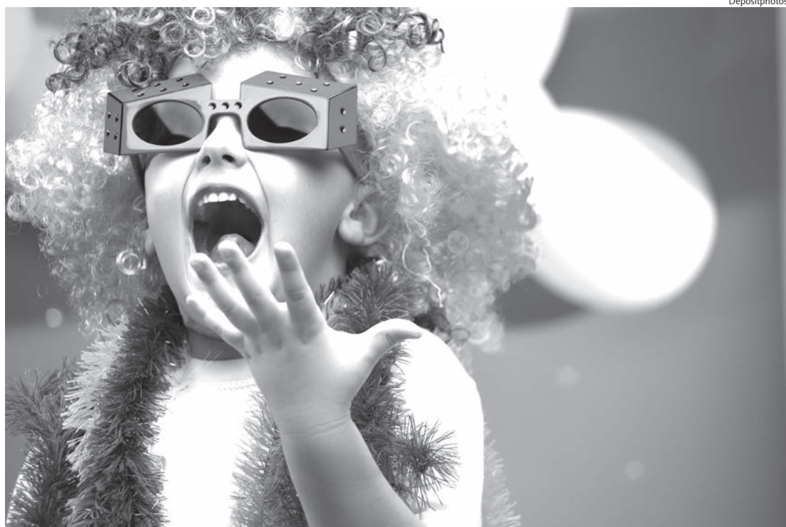
Carnaval marca o retorno nas ruas e os desfiles das escolas de samba pós pandemia

Sábado (18), a partir das 20h30, desfile da es-