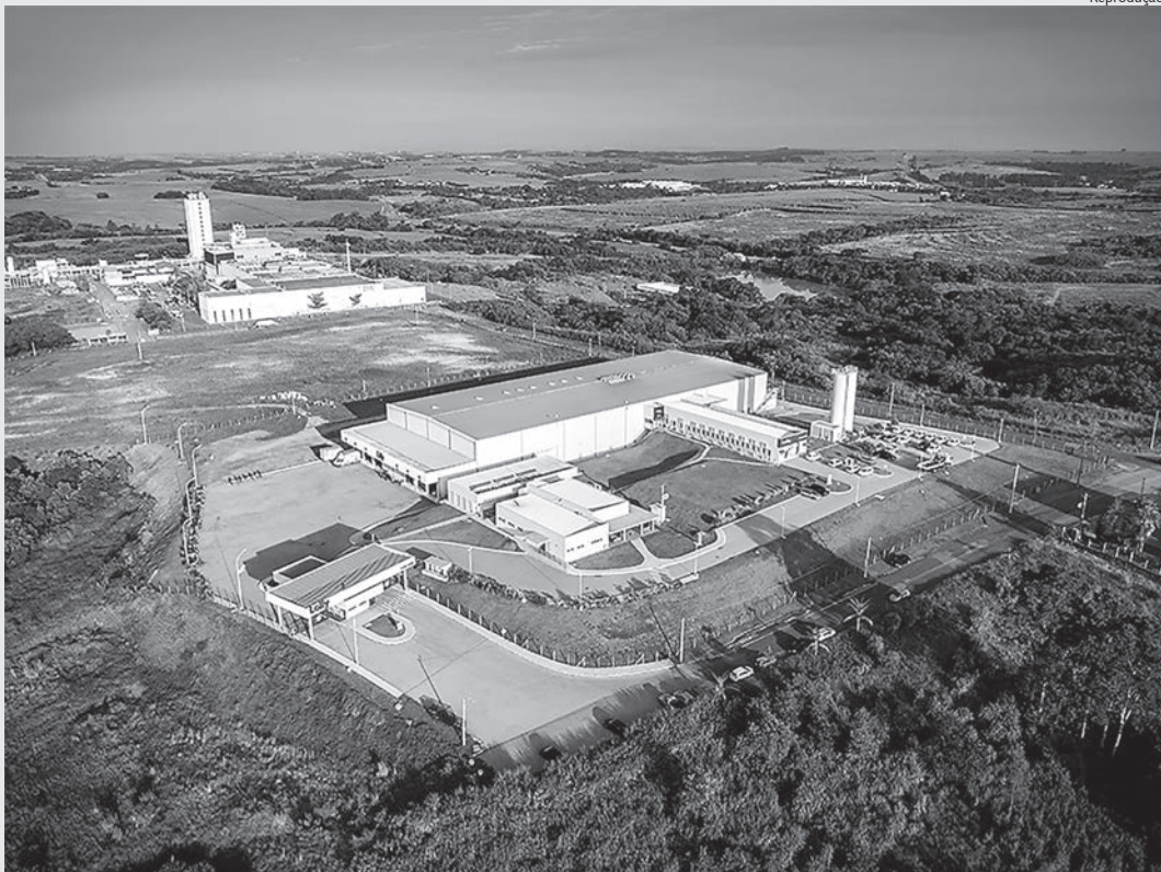
Empresa está sediada no Distrito Industrial de Capivari

Internacionalmente conhecida, com presença em 3 continentes: América, Europa e África, a Lolly Brasil comemora em 2023 seu aniversário de 33 anos. A empresa se dedica a conhecer e atender mães, papais e seus bebês durante a primeira infância, tem sua trajetória marcada por evolução e investimentos baseados nos pilares ESG.