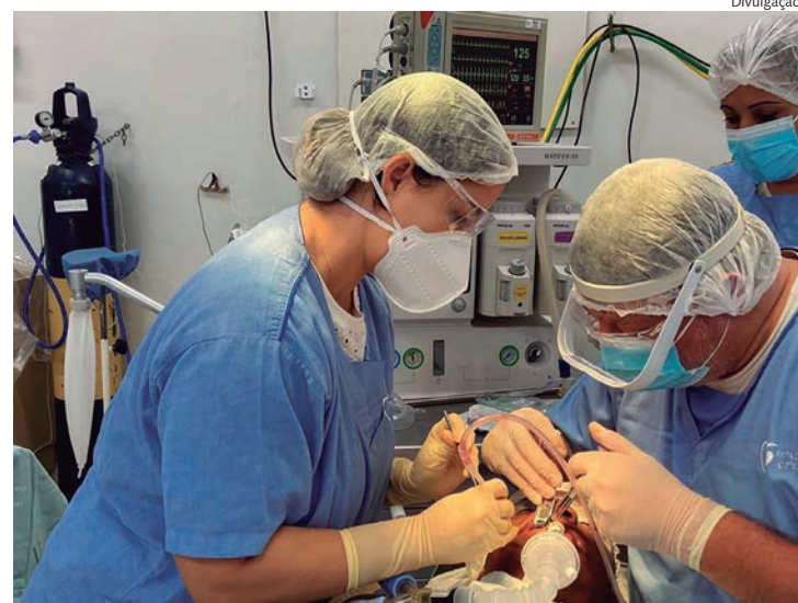
Pacientes são atendidos na estrutura do hospital

A Santa Casa reforça que seu lema é atender com dignidade, respeito, amor