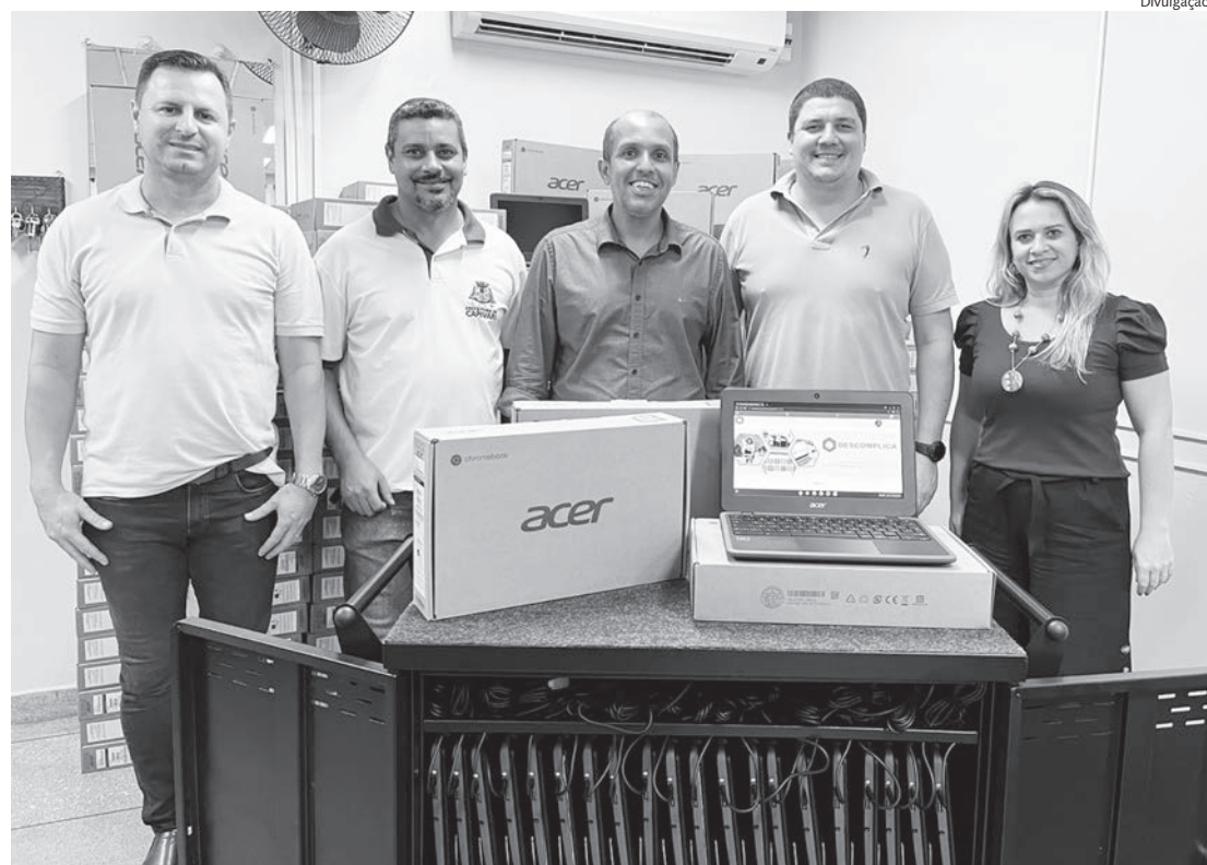
Equipamentos foram apresentados esta semana aos responsáveis pela pasta

como os tablets, não serão levados para casa. Os alunos farão o uso do