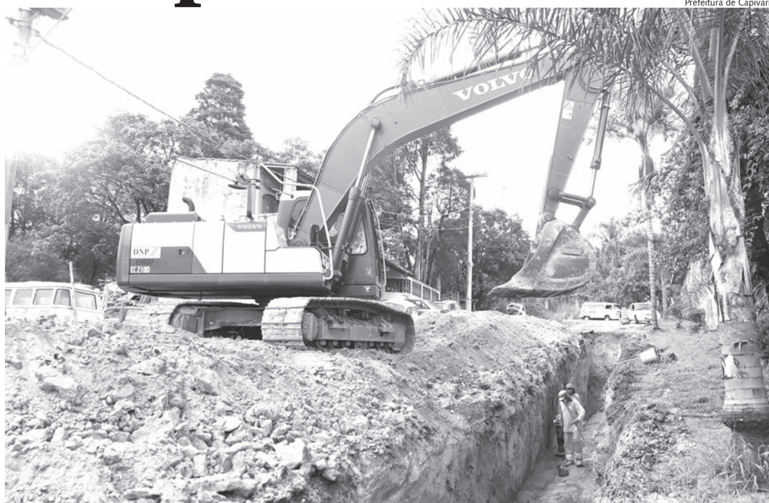
Obras no bairro Bosque dos Pinheiros tiveram início na sexta-feira (13)