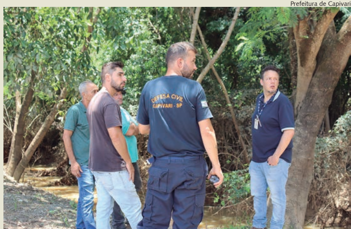
Técnicos visitaram pontos do Rio Capivari

Buscando formas de solucionar os problemas que Capivari e região vem enfrentando com as enchentes, na época das fortes chuvas, na manhã de quarta-feira, 18, o governo municipal recebeu a equipe técnica do Departamento de Águas e Energia Elétrica (DAEE), do Governo do Estado de São Paulo.