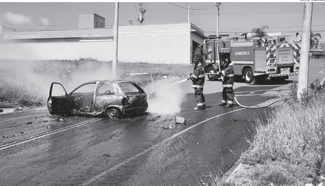
Momento em que os bombeiros controlavam as chamas em acidente de Rafard

Uma batida envolvendo dois carros terminou em incêndio na manhã de terça-feira (17), na rua Maria Madalena Andreello Fontolan, em Rafard. Uma pessoa teve ferimentos leves e foi encaminhada para Unidade Básica de Saúde (UBS) do município.