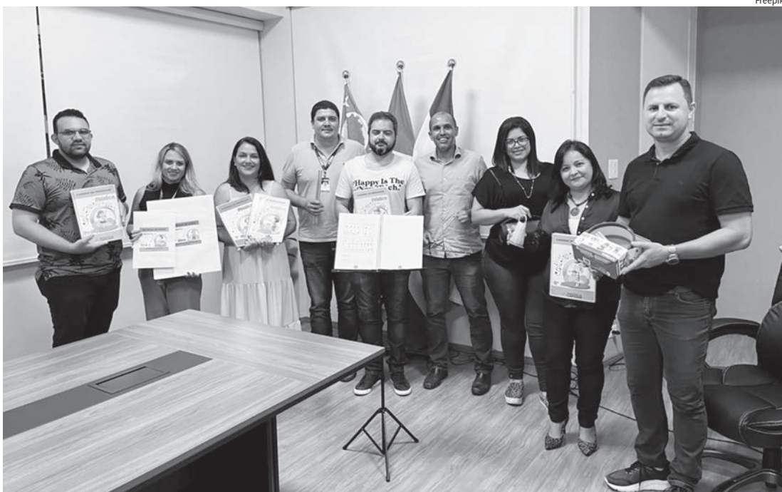
Foram comprados caxixis, tamboretos, pandeiros, flautas doce, triângulos, bolinhas e baquetas