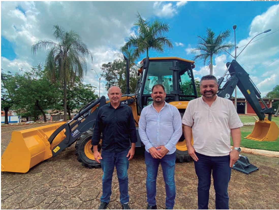
Prefeitura de Rafard

Máquina atenderá serviços públicos na área urbana e rural. Página 8