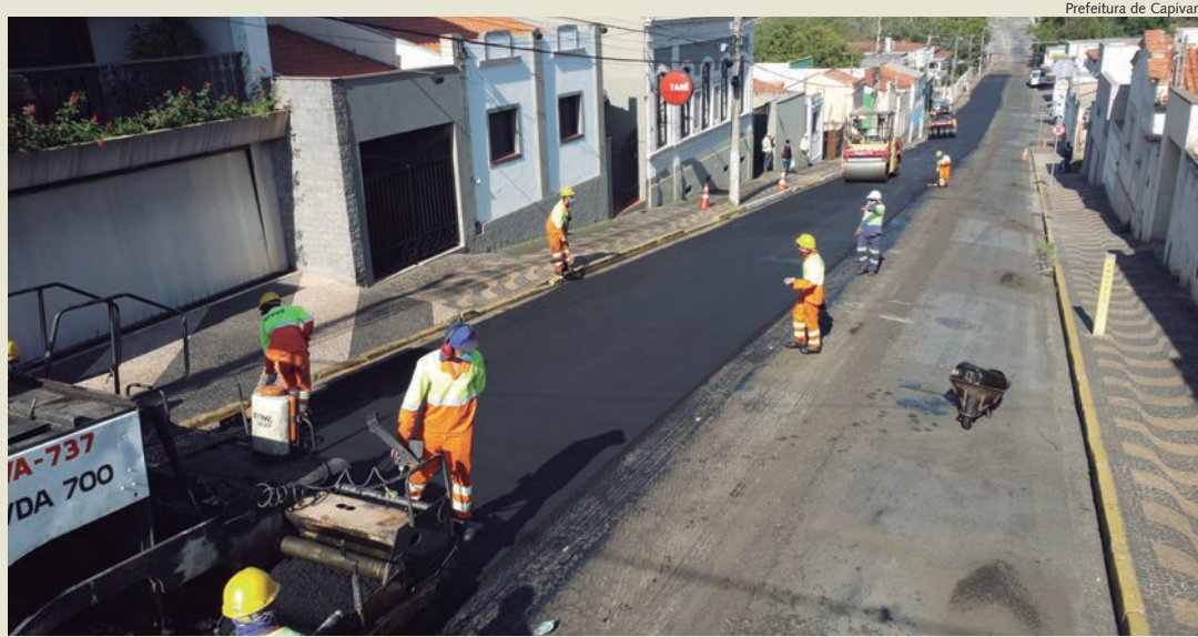
Trecho de 750 metros de extensão recebeu novo asfalto na região central de Capivari

Segundo o governo municipal, um estudo dos agentes de trânsito apontou a necessidade de recape. "A rua Bento Dias estava deteriorada e, com muita eficiência, substituímos o asfalto