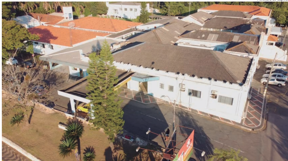
Protocolos são válidos para visitas de pacientes em internações clínicas, na UTI ou maternidade

Para mais informações, a Santa Casa está localizada na Praça Dr. Mário Dias de Aguiar, no bairro Vila do Carmo, e atende pelo telefone (19) 3491-9191.