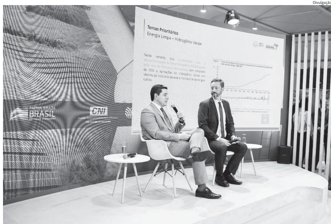
Ministro do Meio Ambiente, Joaquim Leite, participou da abertura diretamente do Brasil

Em sua apresentação, Fabio Ribeiro destacou a atuação do BNDES no desenvolvimento e fortalecimento do mercado de créditos de carbono no Brasil e lembrou que o banco já realizou dois Editais de Chamada para Aquisição de Créditos de Carbono no Mercado Voluntário. O primeiro, em maio, foi uma operação-piloto no valor de até R$ 10 milhões. O segundo, no final de agosto, teve valor de R$ 100 milhões. A primeira chamada teve uma demanda de projetos de R$ 20 milhões. Na segunda, a demanda foi