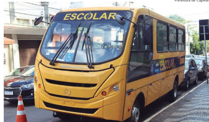
Prefeitura de Capivari

O novo veículo tem capacidade para 29 pessoas e deve auxiliar o transporte de alunos, sobretudo dos estudantes PCD. Página 12