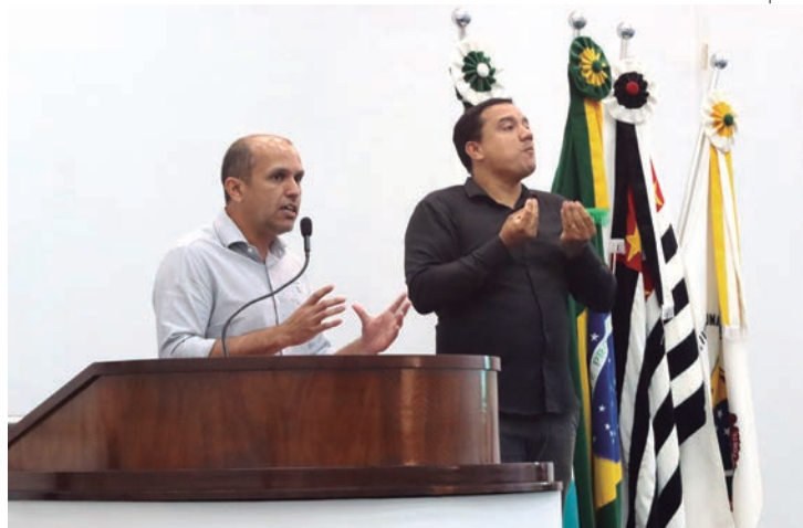
Prefeitura de Capivari

População poderá opinar e participar do planejamento de desenvolvimento da cidade para os próximos anos. Página 12