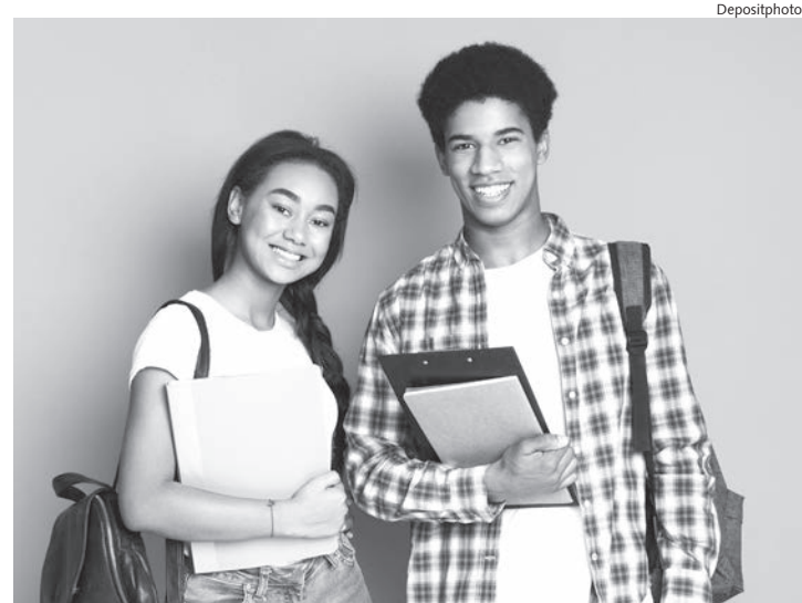
415 escolas farão parte do programa de ensino integral

O Programa de Ensino Integral (PEI) foi criado em 2012 com o objetivo de expandir e repensar o papel da escola na vida dos estudantes. Nesses últimos dez anos, esse modelo de ensino tem sido aperfeiçoado para oferecer educação inte-