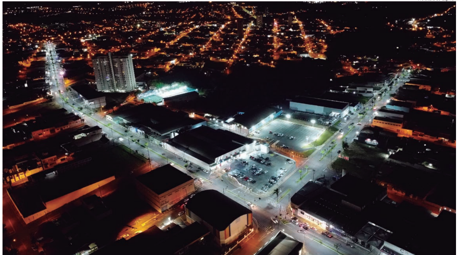
Prefeitura de Capivari

População poderá opinar e participar do planejamento de desenvolvimento da cidade para os próximos anos. Página 12