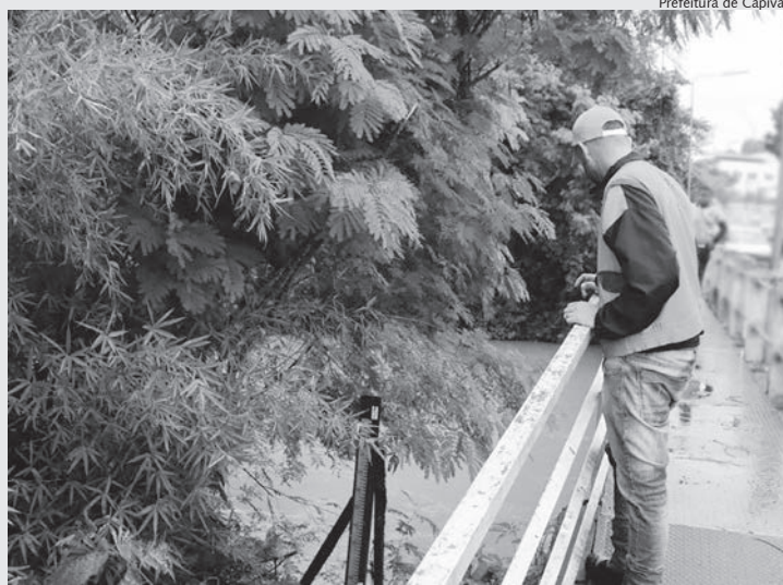
Prefeitura de Capivari

Segundo o governo municipal, a Defesa Civil fará rondas nos locais passíveis de inundações, enchentes e alagamentos,