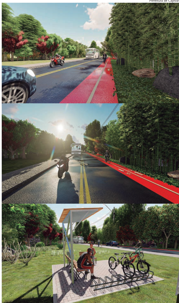
Projeto apresentado pela Prefeitura de Capivari