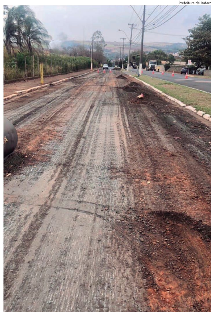
Serviços foram iniciados esta semana na avenida São Bernardo

Como o período da obra é de 3 meses e o início estava programado para junho, os serviços devem ser entregues ainda este mês.