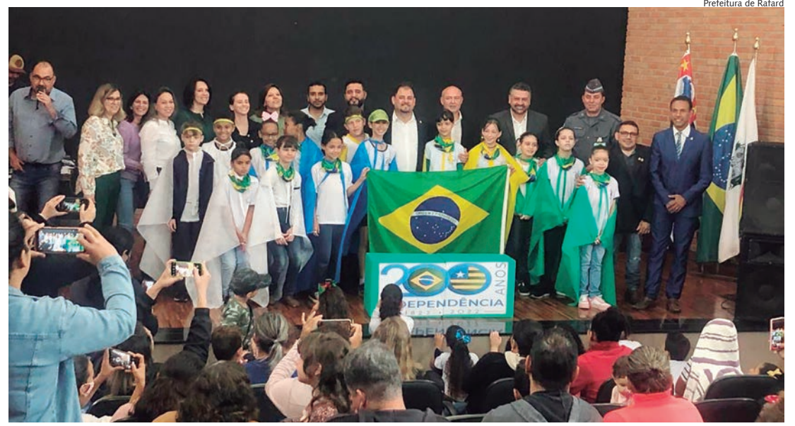
Apresentações de alunos das escolas municipais e da banda marcial marcaram 7 de setembro

O encontro entre índios e portugueses foi amigável e de mútuo interesse por ambas as partes. É tanto que, até hoje, a receptividade, a boa acolhida e a alegria são marcas herdadas e presentes no comportamento de todo o povo