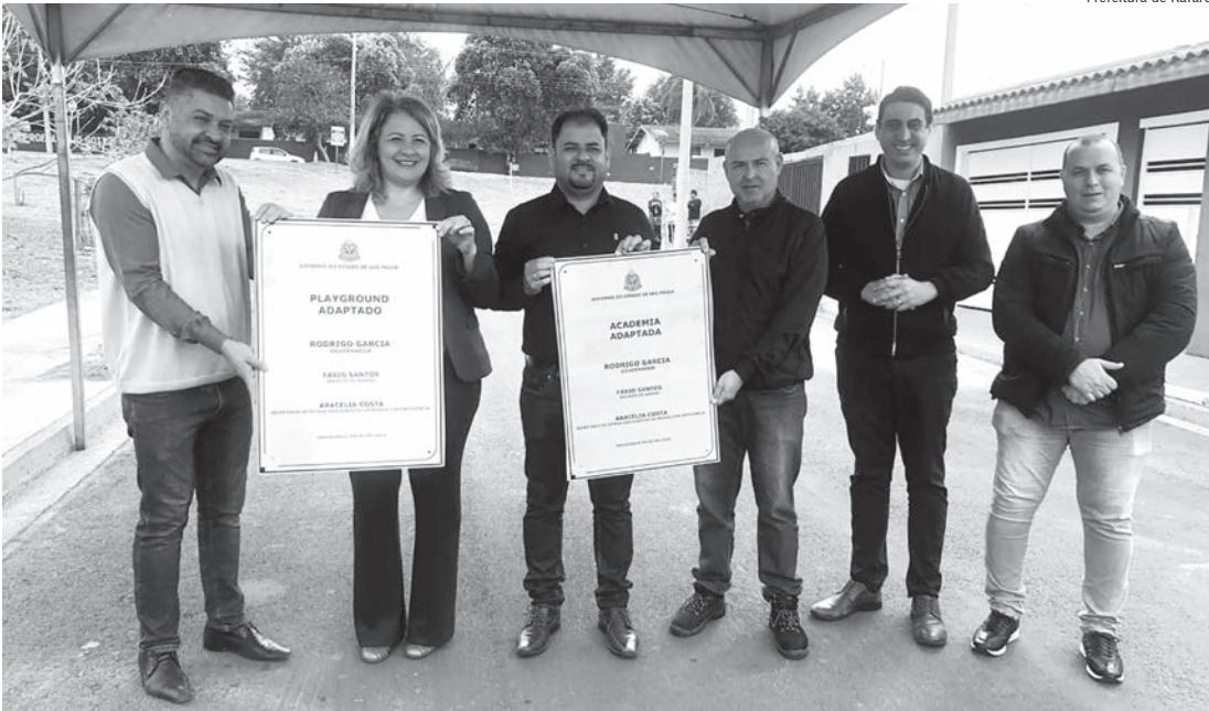
Secretária da Pessoa com Deficiência do Estado participou da inauguração em Rafard

Na manhã de terça-feira (6), a Prefeitura de Rafard inaugurou oficialmente a academia e playground adaptados, que vai atender os moradores do conjunto habitacional Lurdes Abel. A solenidade contou com a presença do prefeito Fabio Santos e da secretária da Pessoa com Deficiência do Estado de São Paulo, Aracélia Costa.