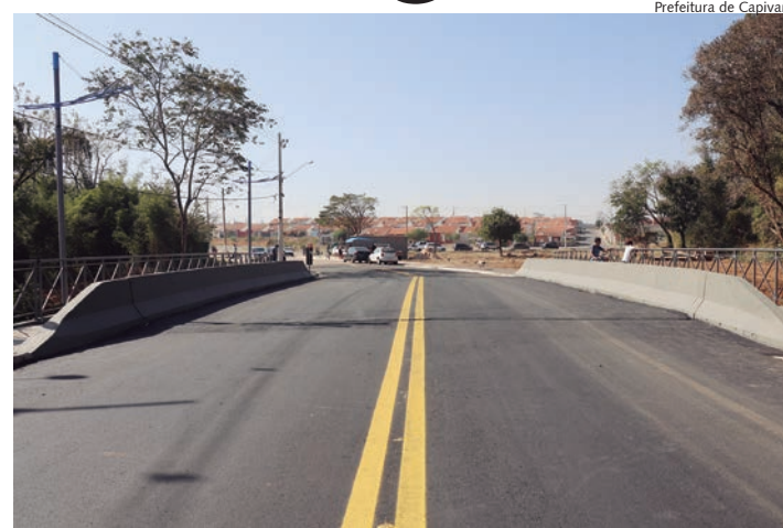
Obra foi inaugurada no último domingo, em Capivari

Riccomini destacou a importância que a conclusão das obras tem para a população da região. "Após muito empenho, finalizamos a nova ponte de acesso ao bairro São João. A obra vai facilitar a vida