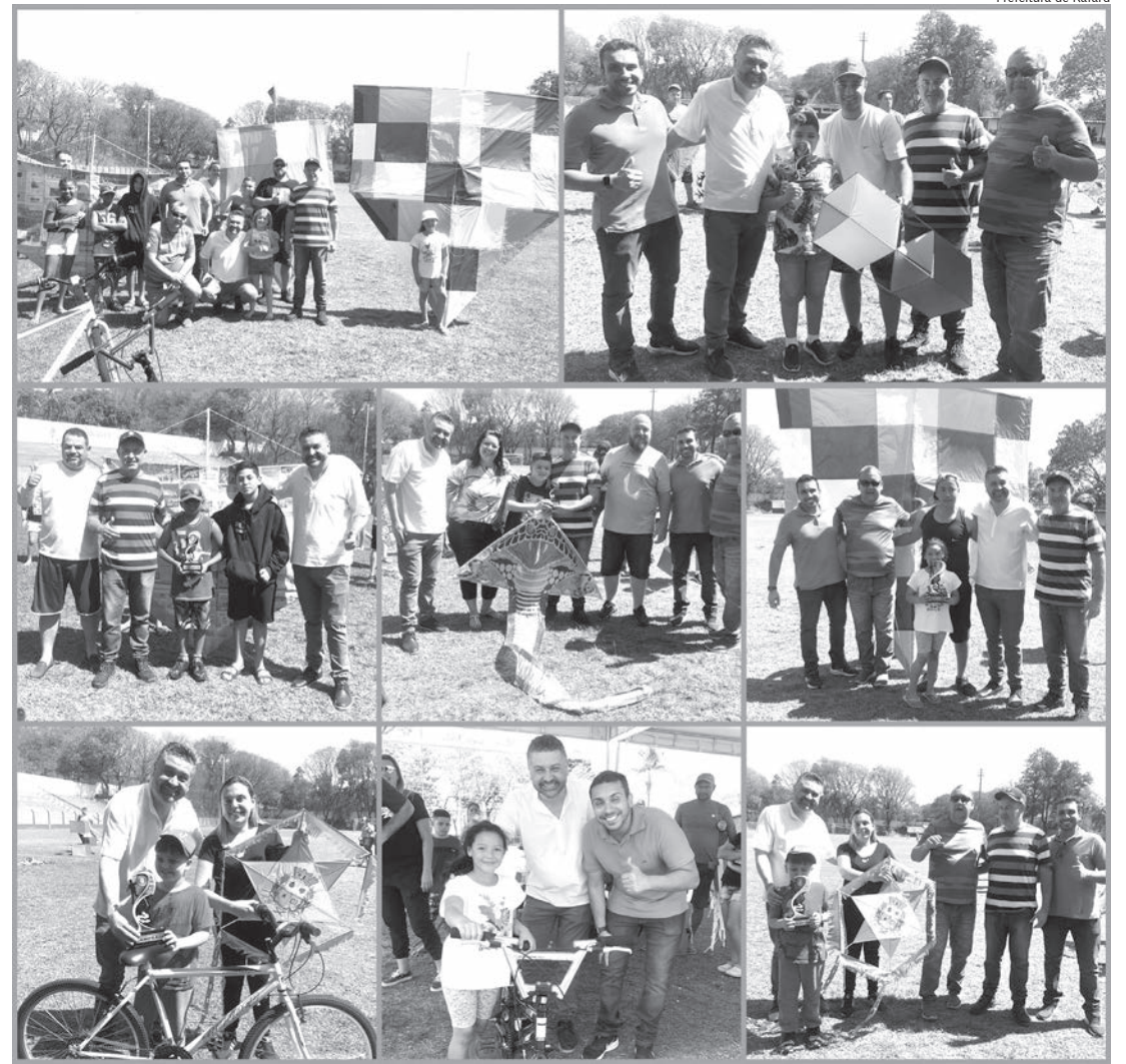
Evento foi realizado no estádio municipal Jair Forti

No último domingo (28), a Prefeitura de Rafard, através da Diretoria de Cultura, Esporte e Turismo, realizou o 2º Campeonato “Pipas sem Mortes”. O evento aconteceu no Estádio Municipal Jair Forti, com distribuição gratuita de pipoca e algodão doce.