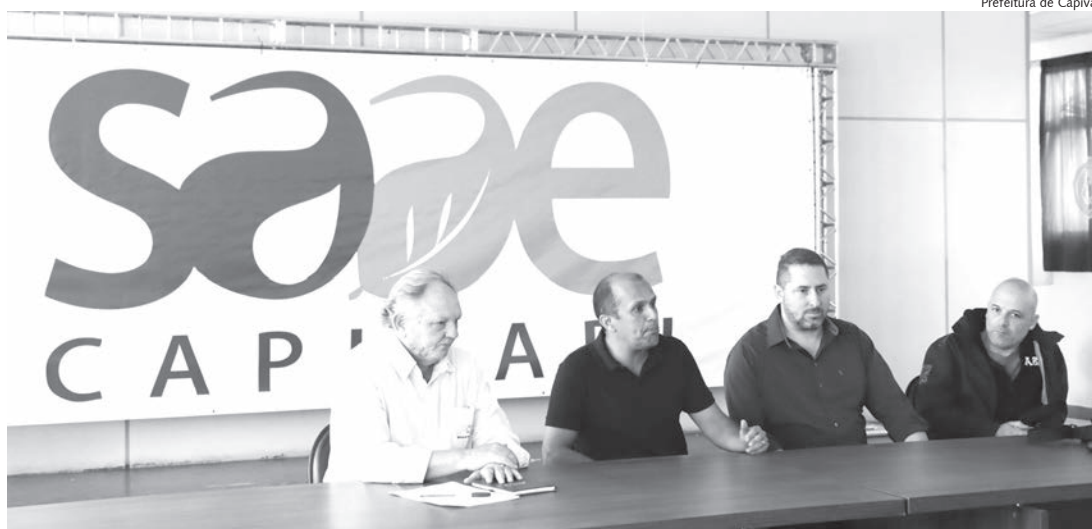
Programa foi apresentado nesta semana; software vai auxiliar nas atividades diárias do Saae

Por ter o maior índice da rede de abastecimento de água mapeada, Capivari foi escolhida para ser a cidade modelo deste sistema ainda no ano de 2021. Com a implantação deste programa, o município se torna a primeira cidade dentre as 66 participantes da Agência das Bacias PCJ