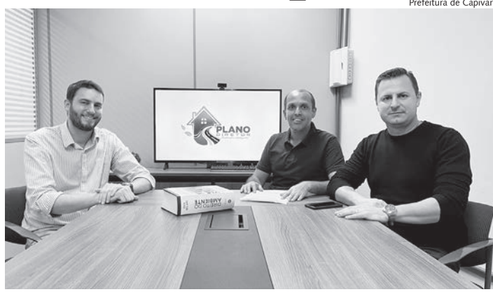
Projeto estipula diretrizes para desenvolvimento da cidade, pelo menos nos próximos 10 anos

Para isso, será necessária participação popular para definir os