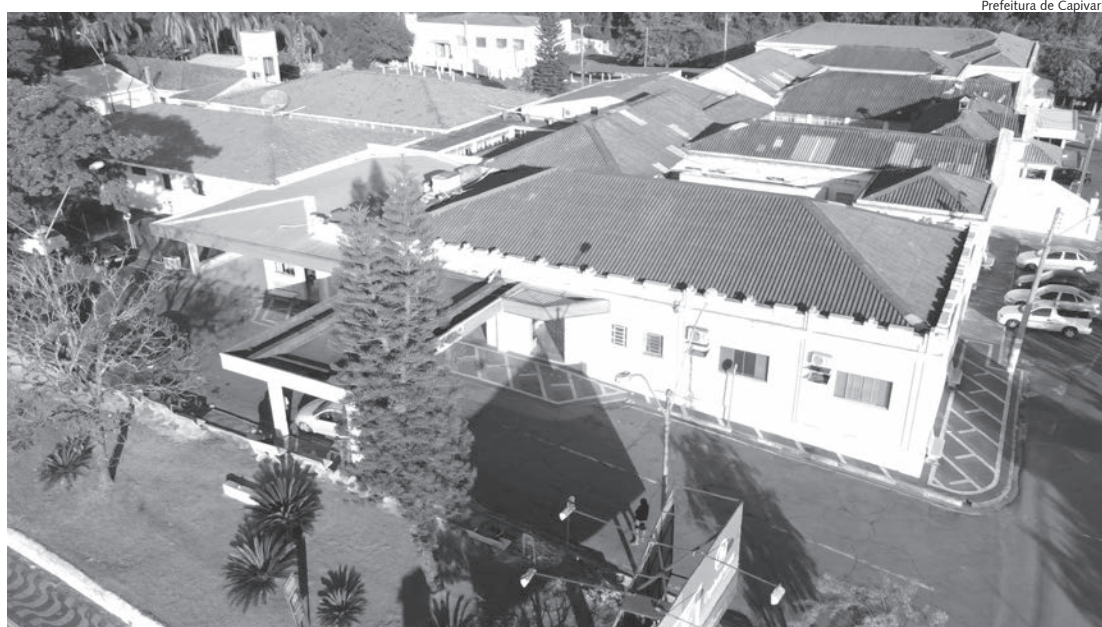
Santa Casa atende diariamente, 24 horas do paciente.

Cada paciente que é transferido para a UTI tem o índice "Apache II" determinado. Essa informação é fundamental para estabelecer a gravidade do quadro clínico que o paciente está, sendo calculado através da aferição de diversos sinais vitais, como por exemplo, frequência cardíaca, pressão arterial, frequência respiratória, entre outros. Quando esse índice ultrapassa a marca de 21 pontos, significa gravidade mais alta no estado de saúde