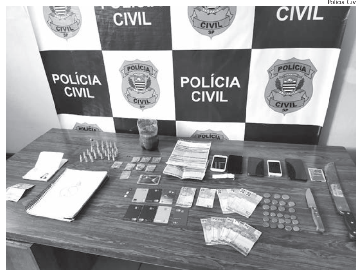
Drogas, celulares e materiais provenientes do tráfico apreendidos em operação da Polícia Civil

Durante as diligências, os policiais localizaram diversas porções de entorpecentes (maconha, cocaína e droga sintética/k4) e materiais provenientes do tráfico de drogas. Celulares, dinheiro e outros objetos também foram apreendidos.