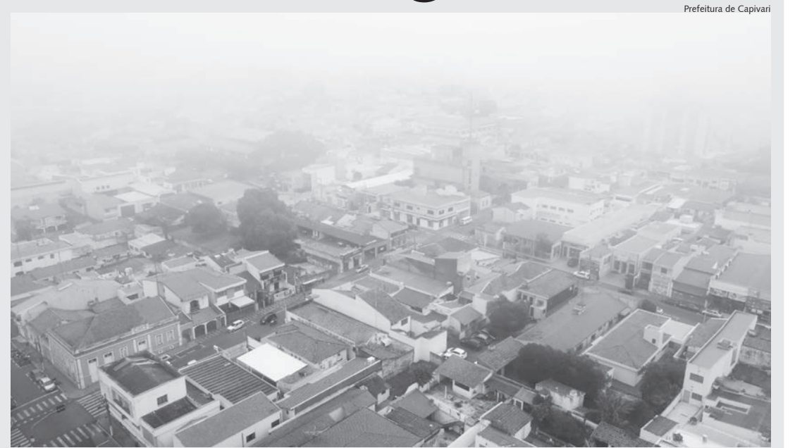
Fortes chuvas e queda na temperatura são esperadas para este fim de semana na região

Em caso de necessidade, a população pode entrar em contato com a Defesa Civil pelo 199 ou (19) 3492-3186. A Guarda Civil atende pelo 153, 24 horas por dia, sete dias por semana. O Corpo de Bombeiros atende pelo 193.