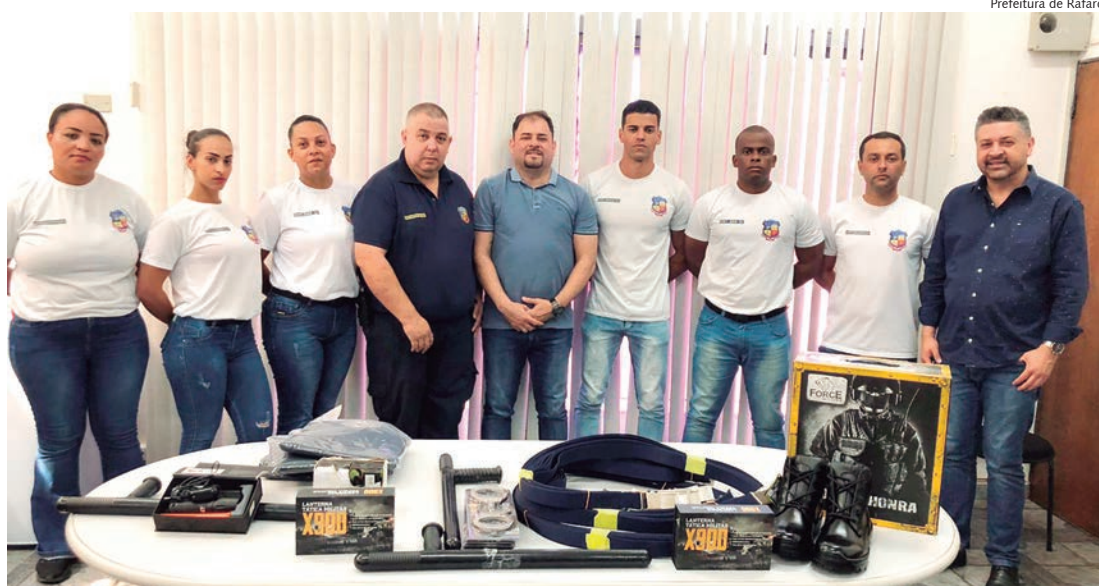
Novos guardas foram recebidos no gabinete do prefeito e receberam equipamentos

“Rafard é mais Segurança! Estes profissionais passaram por capacitação de fevereiro a agosto deste ano e estão aptos para atuarem em nossa cidade. Com todos estes investimentos, visamos melhor segurança para nossos cidadãos e também para o patrimônio público de Rafard”, discursou o chefe do Executivo.