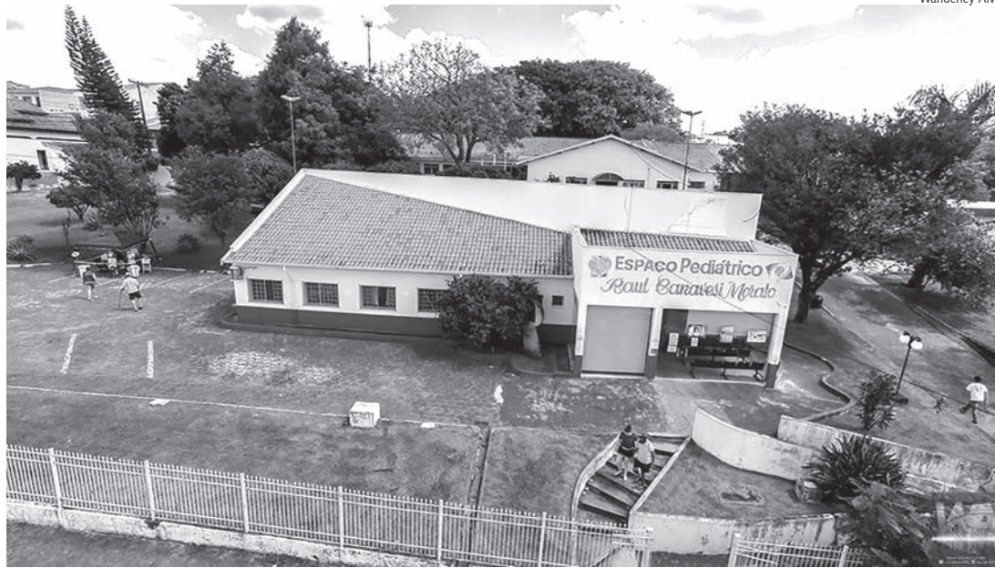
Posto de Vacinação fica na avenida Dr. José Soares de Faria, anexo à Unidade Básica de Saúde

Em geral, a paralisia se manifesta nos membros inferiores de forma assimétrica, ou seja, ocorre apenas em um dos membros. As principais características são a perda da força muscular e dos reflexos, com manutenção da sensibilidade no membro atingido.