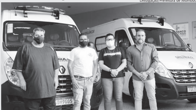
Vereadores e prefeito de Mombuca receberam ambulâncias e apresentaram no paço municipal

O Serviço Municipal de Saúde de Mombuca recebeu na quinta-feira (3), duas ambulâncias novas, vindas através do Governo do Estado. O governo municipal contou com o apoio dos deputados estaduais Rafa Zimbalidi e Alexandre Pereira para a vinda dos dois veículos. “Uma conquista muito importante para o Serviço de Saúde de Mombuca, principalmente, neste período de pandemia, que precisamos