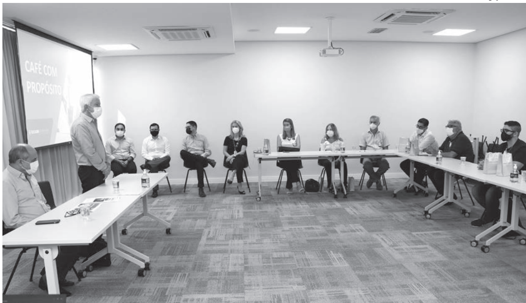
Reunião aconteceu na unidade administrativa do Sicoob Cooplivre em Capivari

“O plano de isenção de pacote de serviços do Sicoob Cooplivre favorece esses projetos comoventes que atuam sem fins lucra-