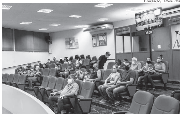
Cerca de 30 moradores estiveram na primeira sessão do ano

A grande polêmica acerca desses recursos é que os valores não podem ser investidos para ajudar diretam-