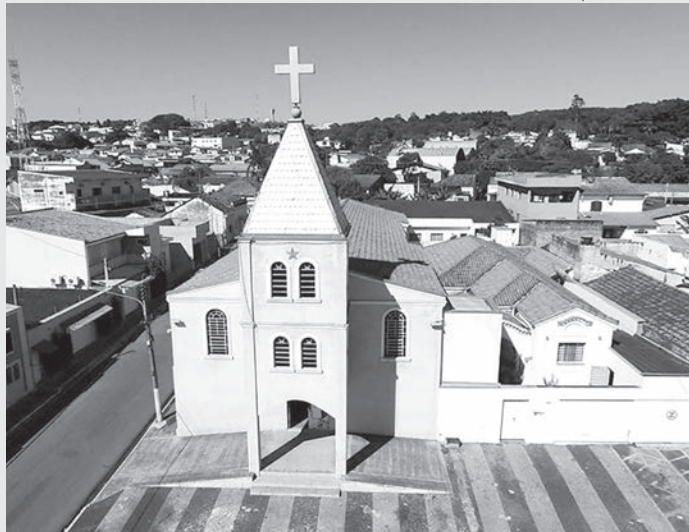
Igreja Matriz de Nossa Senhora de Lourdes

Nesta sexta-feira, 11 de fevereiro, é celebrado o Dia de Nossa Senhora de Lourdes, a madroeira de Rafard e da Paróquia, decretado feriado local.