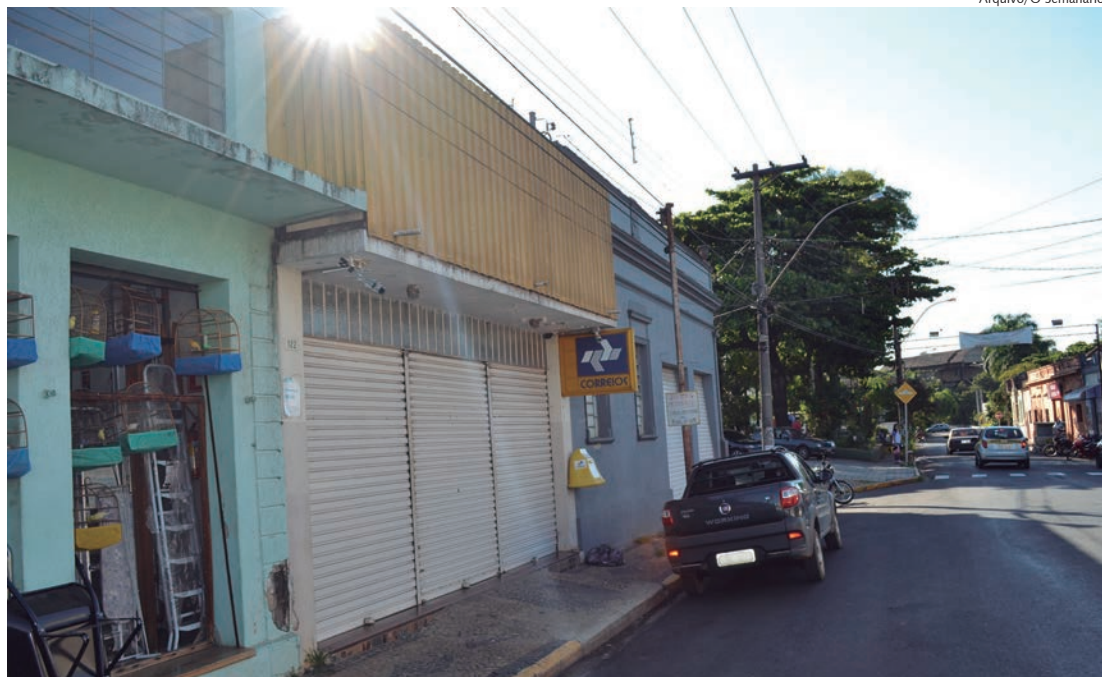
Agência dos Correios em Rafard está localizada na rua Maurício Allain, no Centro da cidade

A reportagem d'O Semanário fez contato com a assessoria de Imprensa dos Correios, mas até o fechamento da edição,