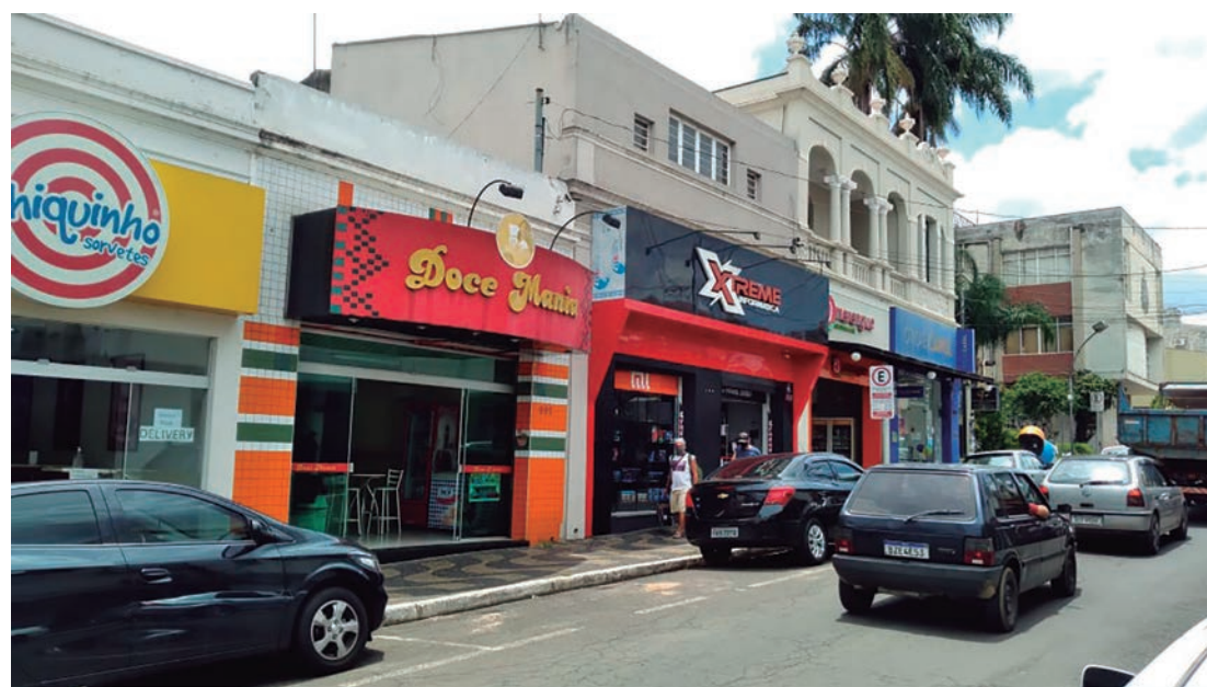
Restrições do Governo Estadual tem prejudicado comerciantes e consumidores

A Prefeitura de Capivari vai seguir as mesmas medidas de flexibilização do comércio anunciadas pelo Governo do Estado, na última quarta-feira (3). Comercios em geral, lanchonetes, restaurantes, salões de beleza e barbearias poderão funcionar nos fins de semana, a partir deste sábado (6), por até oito horas, entre às 6h e 20h.