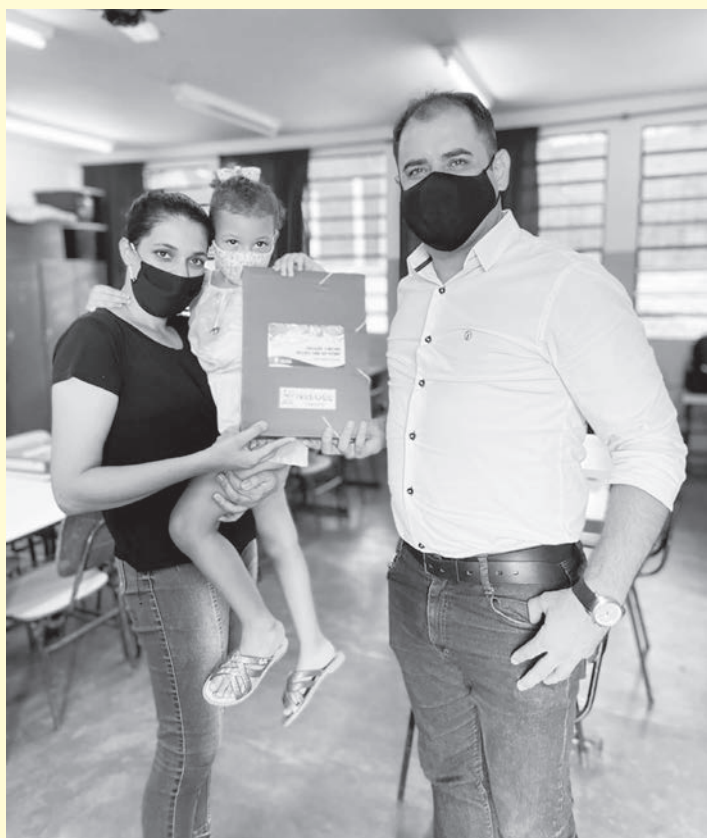
Prefeito participou da entrega dos kits

“Os alunos precisam dar continuidade aos estudos, e muitos, por causa da crise econômica, passam por momentos de dificuldade. Nosso objetivo é oferecer uma Educação de qualidade, onde todos possam ter igualdade de oportunidades para aprender”, pontuou o chefe do Executivo.