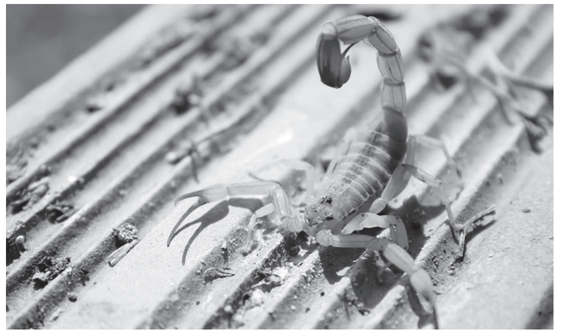
Santa Casa de Capivari administra soro contra picada de escorpiões e também de cobras (Foto ilustrativa)

Área externa do domicílio: Manter os quintais