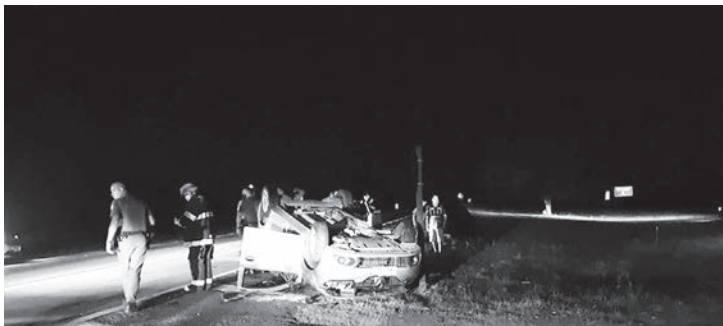
Acidente aconteceu na SP-101, em Capivari

Uma colisão seguida de capotamento deixou duas pessoas feridas, na noite de quarta-feira (14), na Rodovia Jornalista Francisco Aguirre de Proença (SP-101), em Capivari.